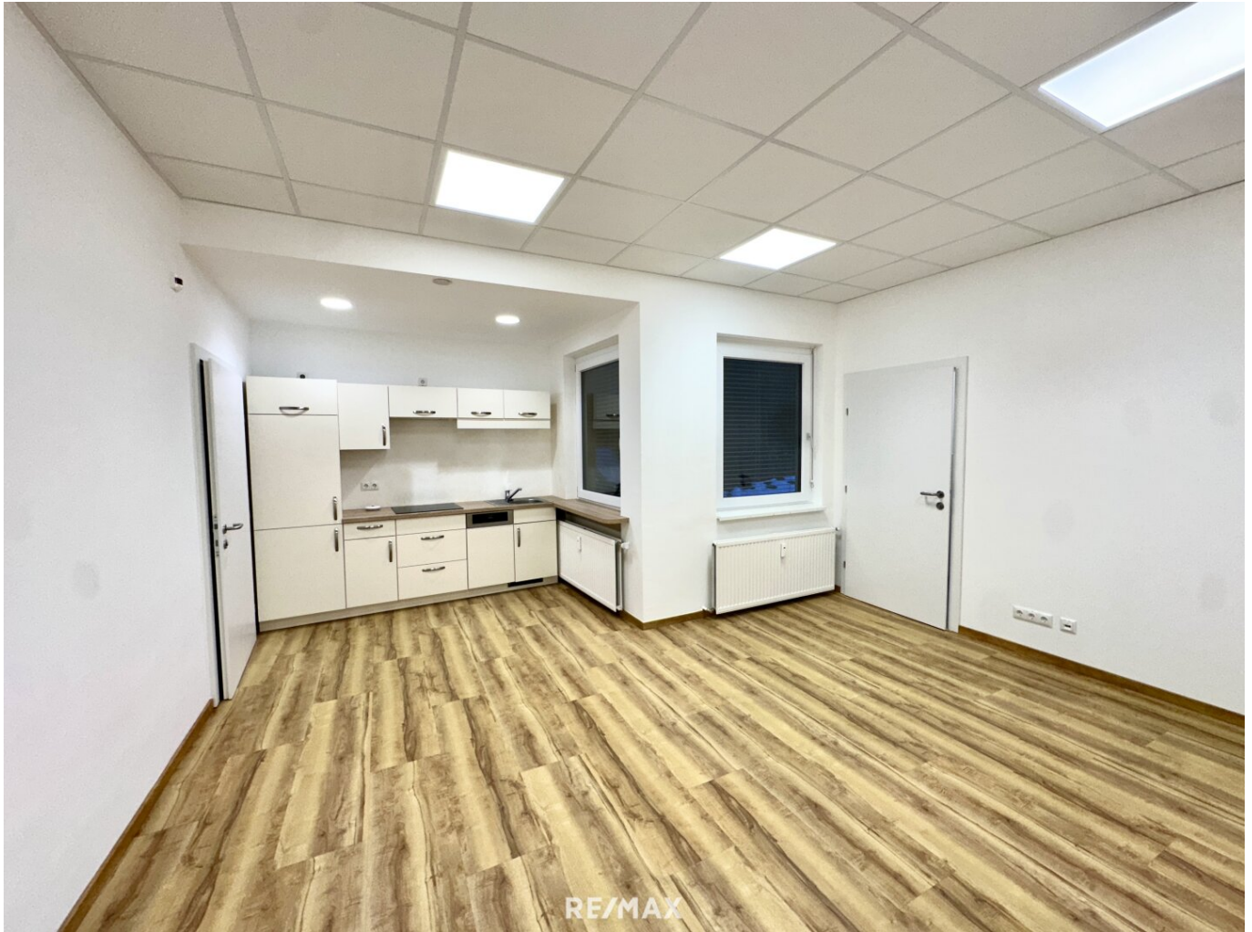
Küche mit Aufenthaltsbereich

Objektnummer: 1679/1595 Eine Immobilie von RE/MAX Life