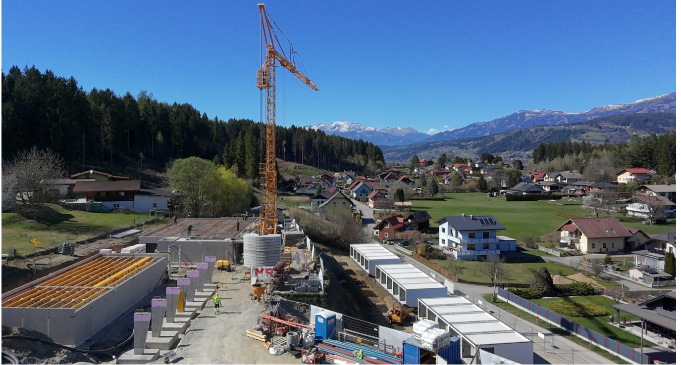
Baufortschritt, Stand 09.04.2026