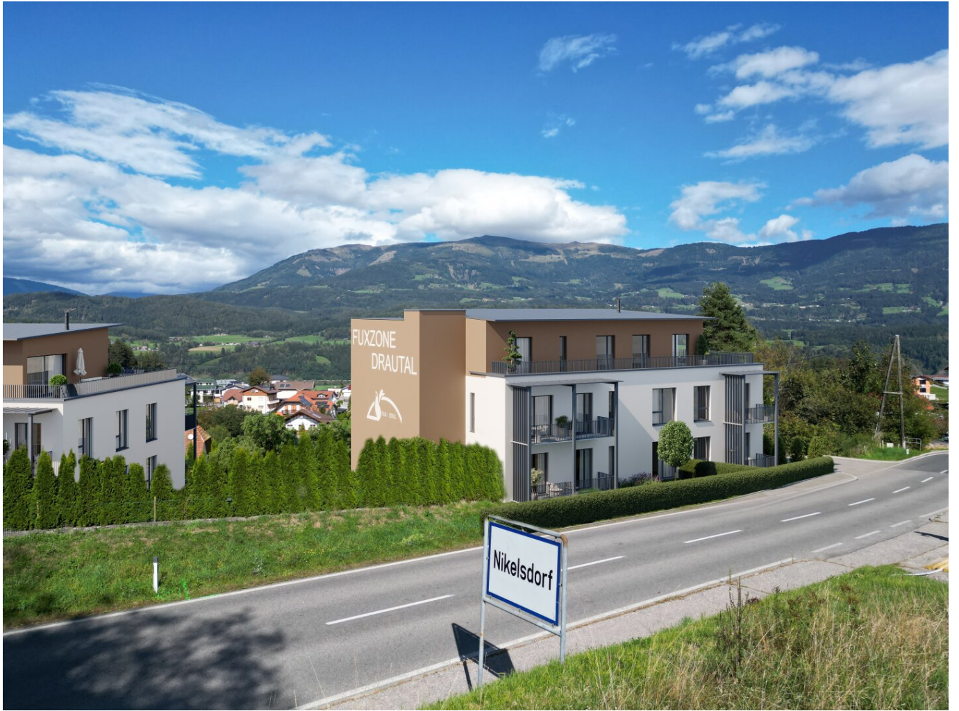
Baufortschritt, Stand 07.04.2026