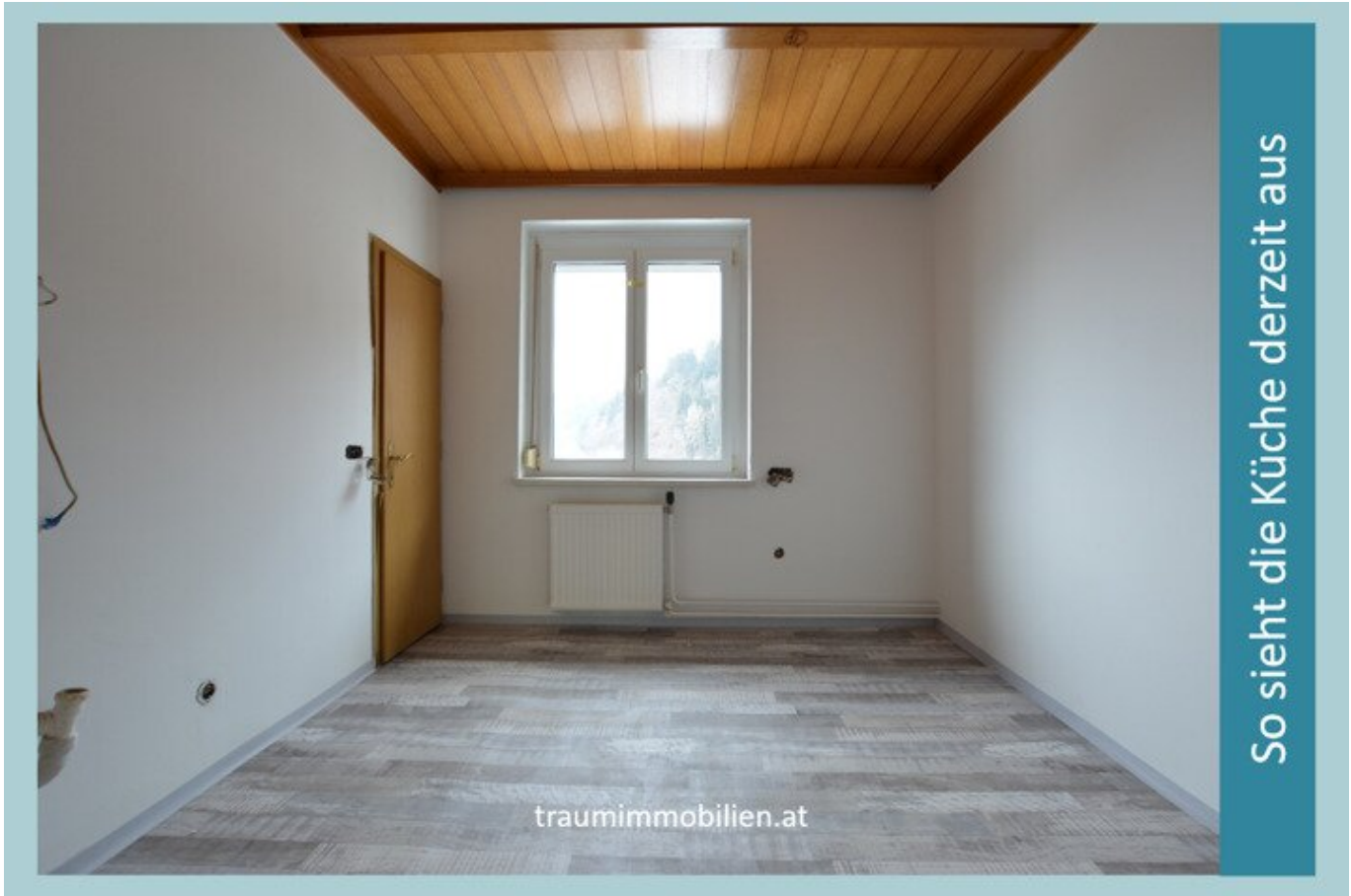
So sieht die Küche derzeit aus