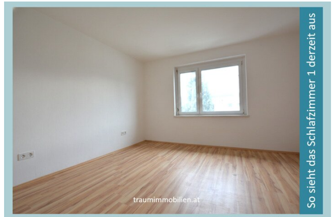
So sieht das Schlafzimmer 1 derzeit aus