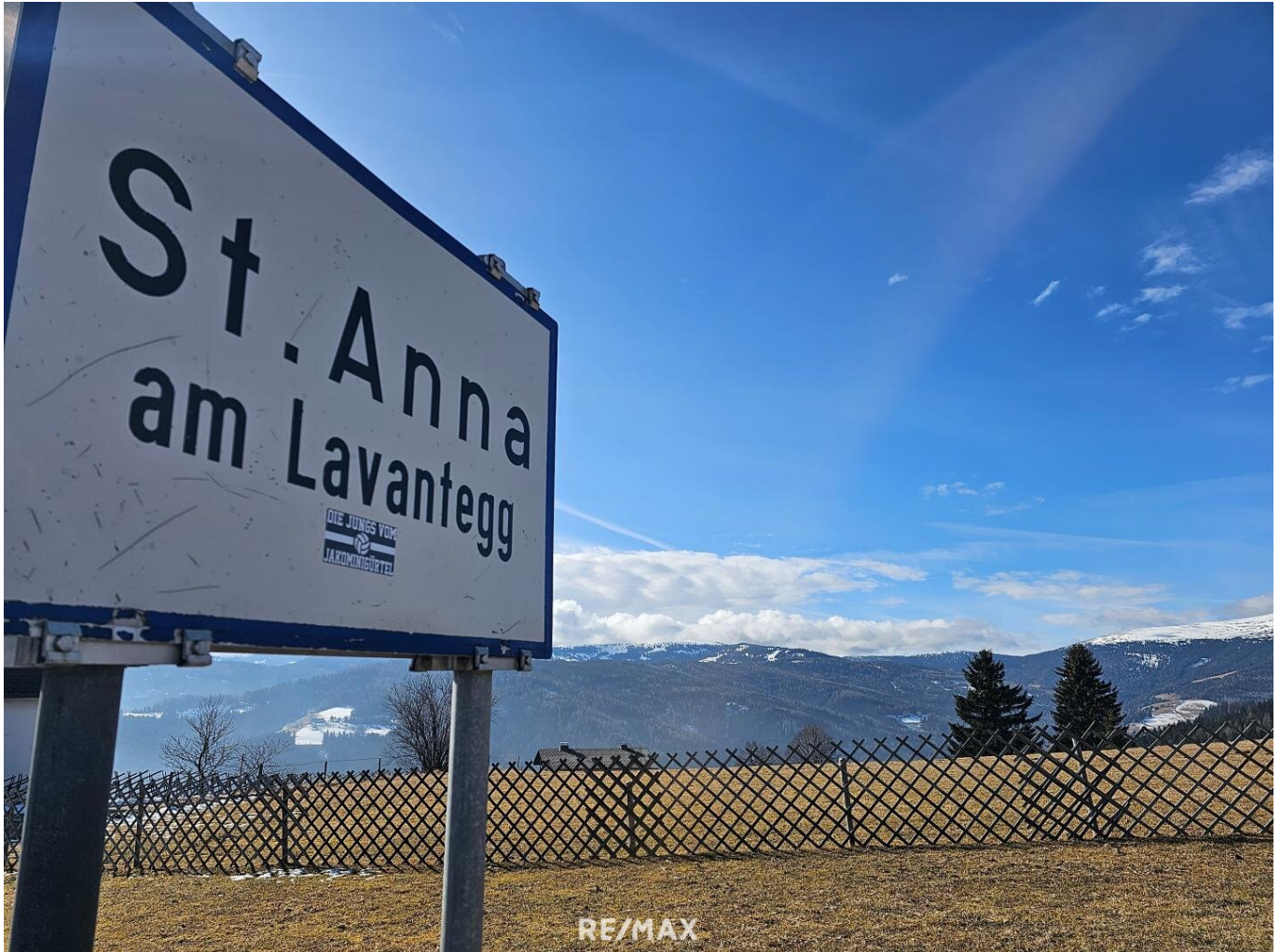
St. Anna am Lavantegg