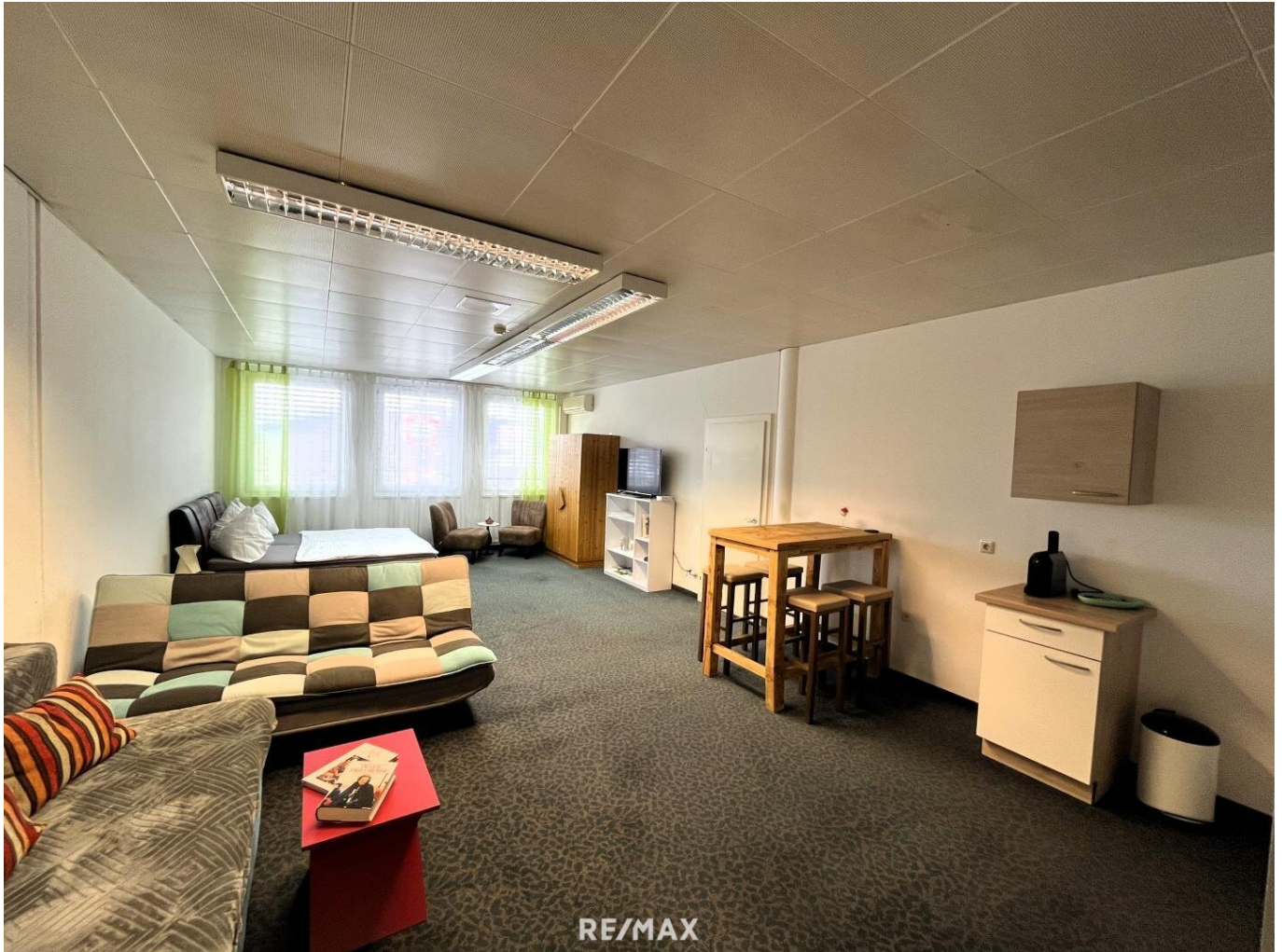
Schlafrum mit Küchezeile D12

Objektnummer: 1679/1566 Eine Immobilie von RE/MAX Life