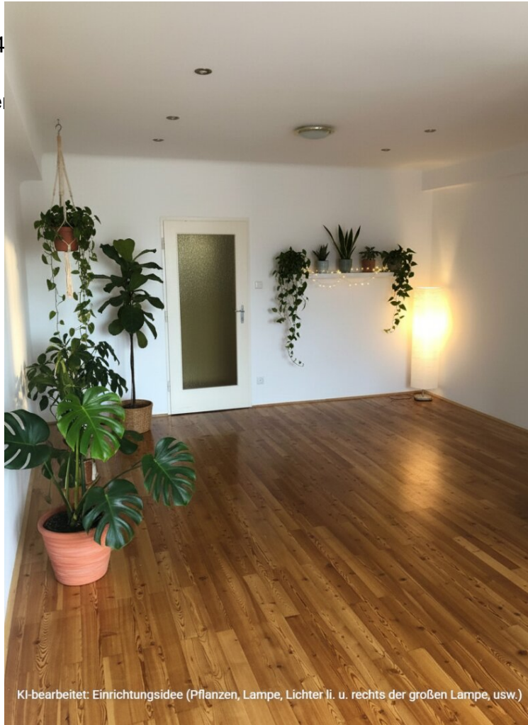
KI-bearbeitet: Einrichtungsidee (Pflanzen, Lampe, Lichter li. u. rechts der großen Lampe, usw.)