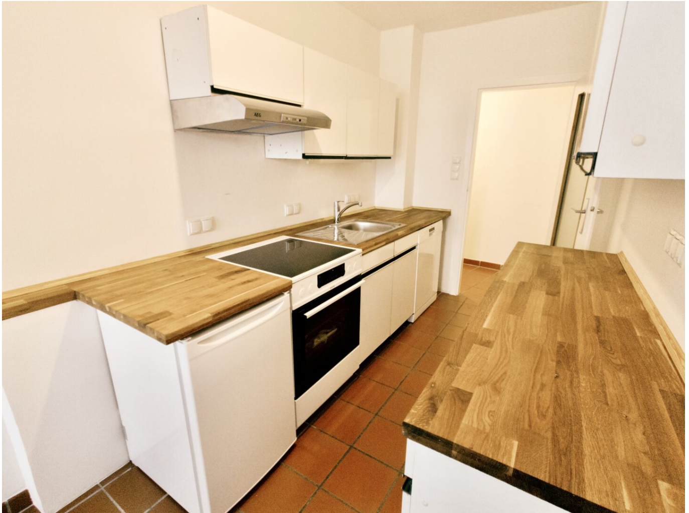
Einbauküche mit neuwertigen Elektrogeräten

Urban & Grün: Nähe Wasserpark Floridsdorf und Bahnhof Floridsdorf | Loggia | U6 Floridsdorf | Aufzug | Sehr gute öffentliche Anbindung