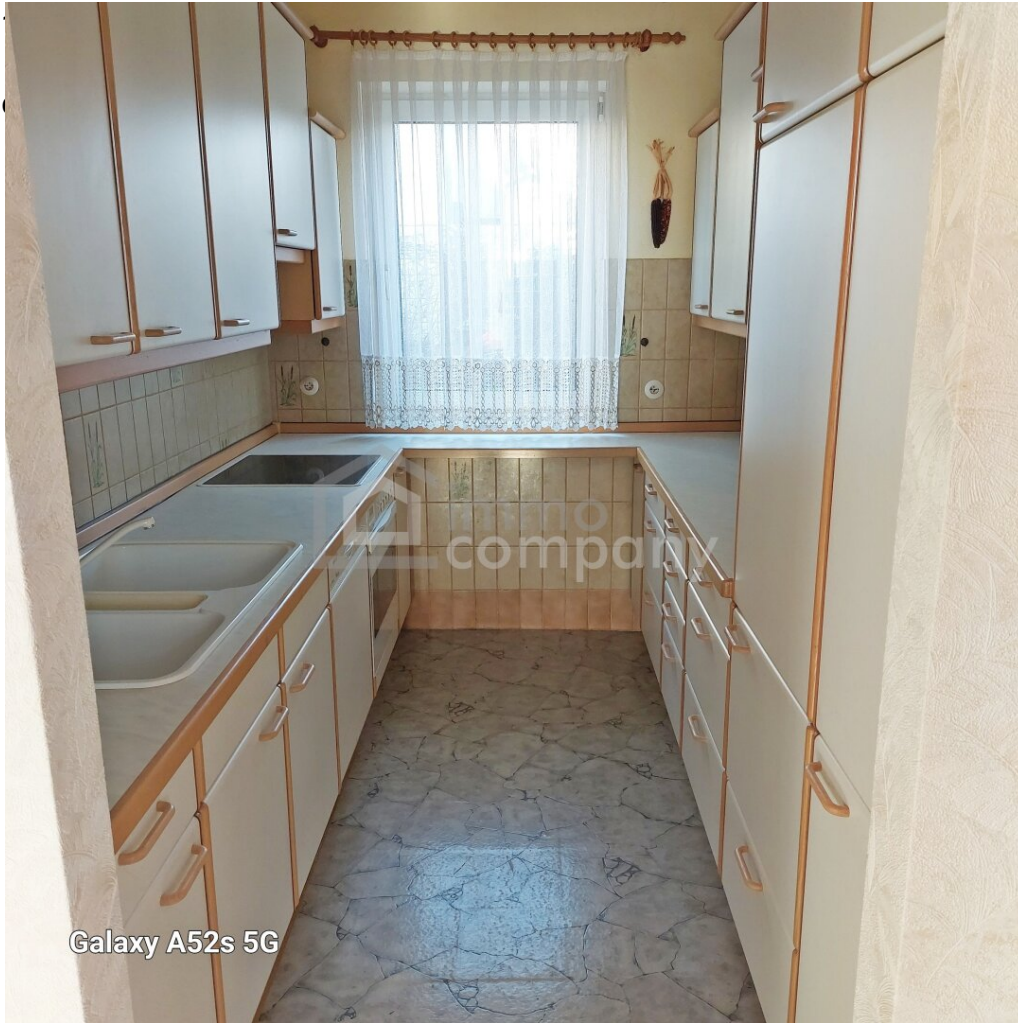
Galaxy A52s 5G