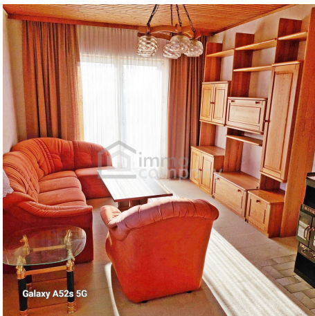
Galaxy A52s 5G