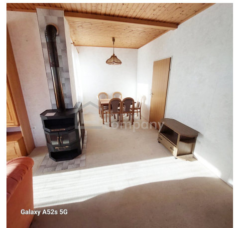
Galaxy A52s 5G