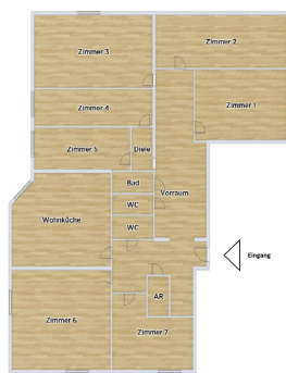
Grundriss-Skizze Top 1 + Top 2