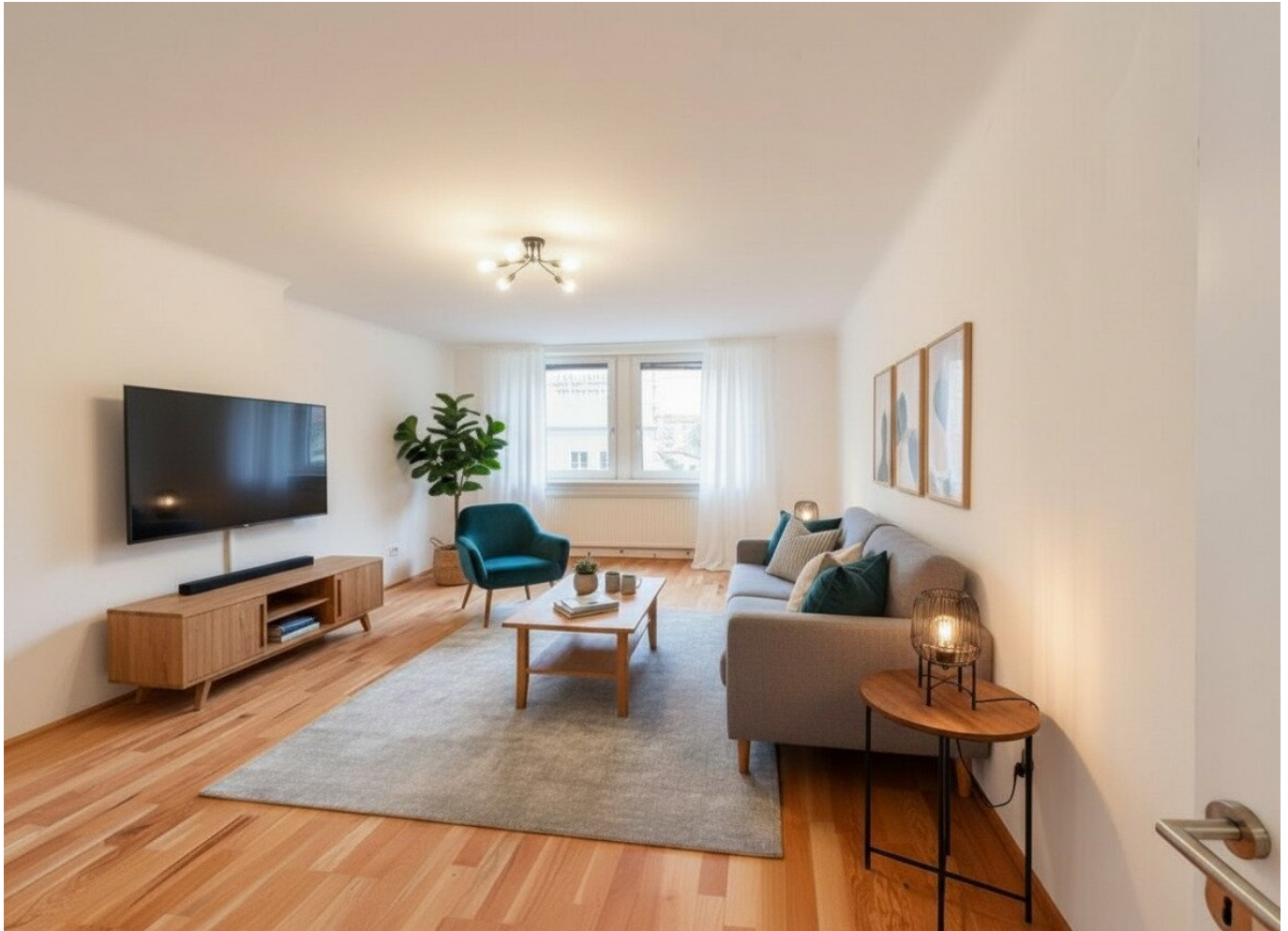
Wohnzimmer (mittels KI möbliert)