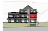
ANSICHT SÜD 1.OG