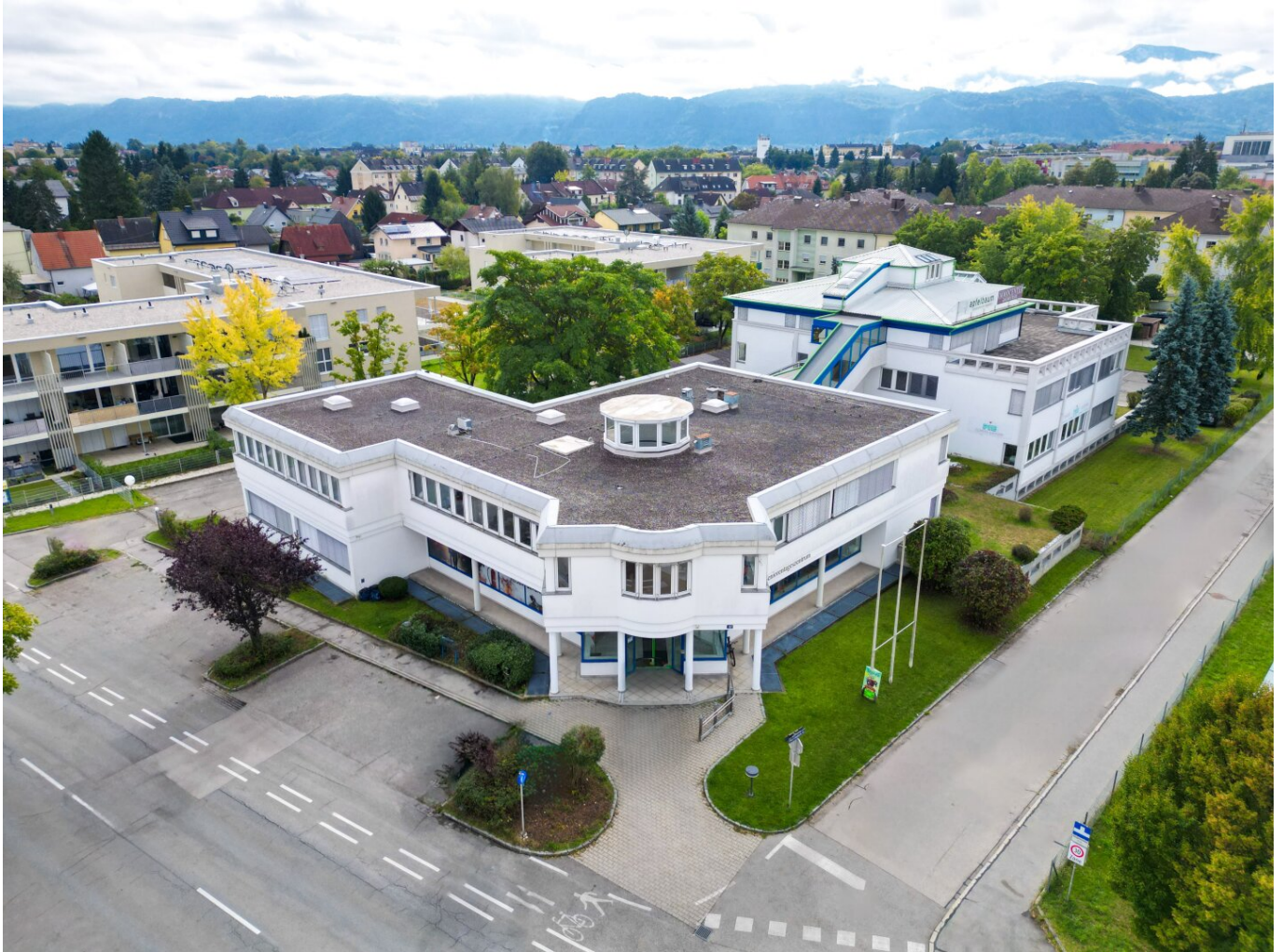
Luftbild von der gesamten Liegenschaft