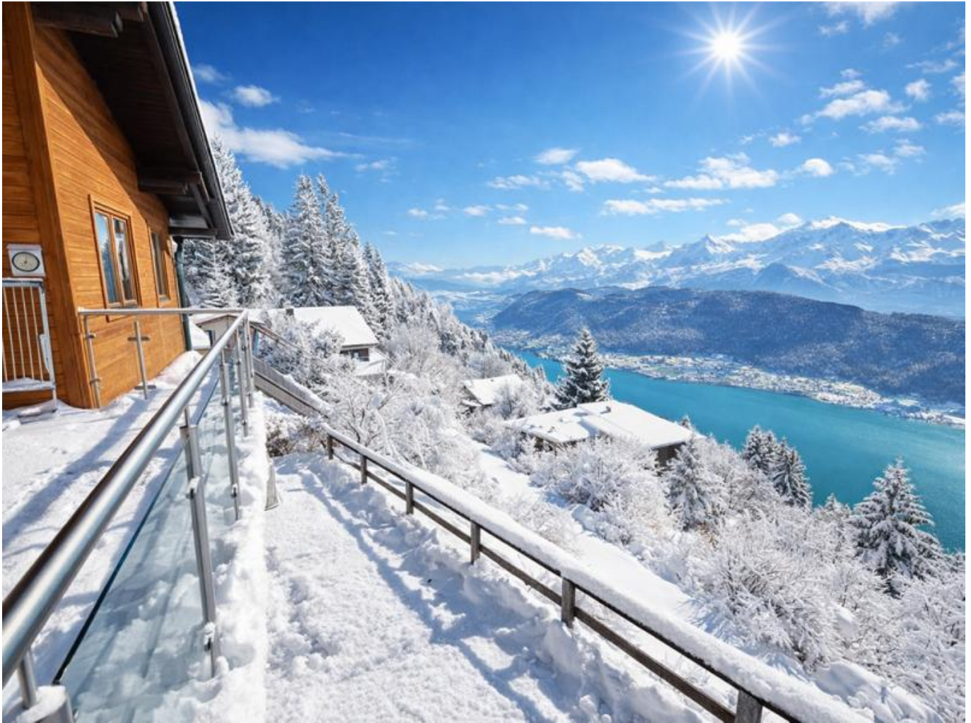
Chalet Ossiacher See

Objektnummer: 905/03576 Eine Immobilie von ATV Immobilien