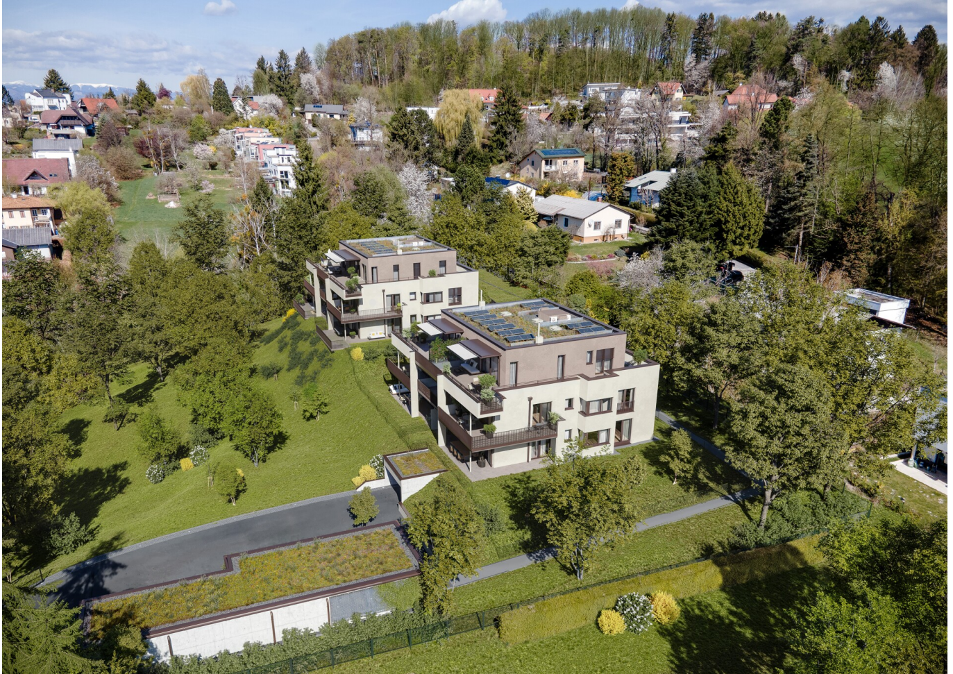
Luftschloss View 2