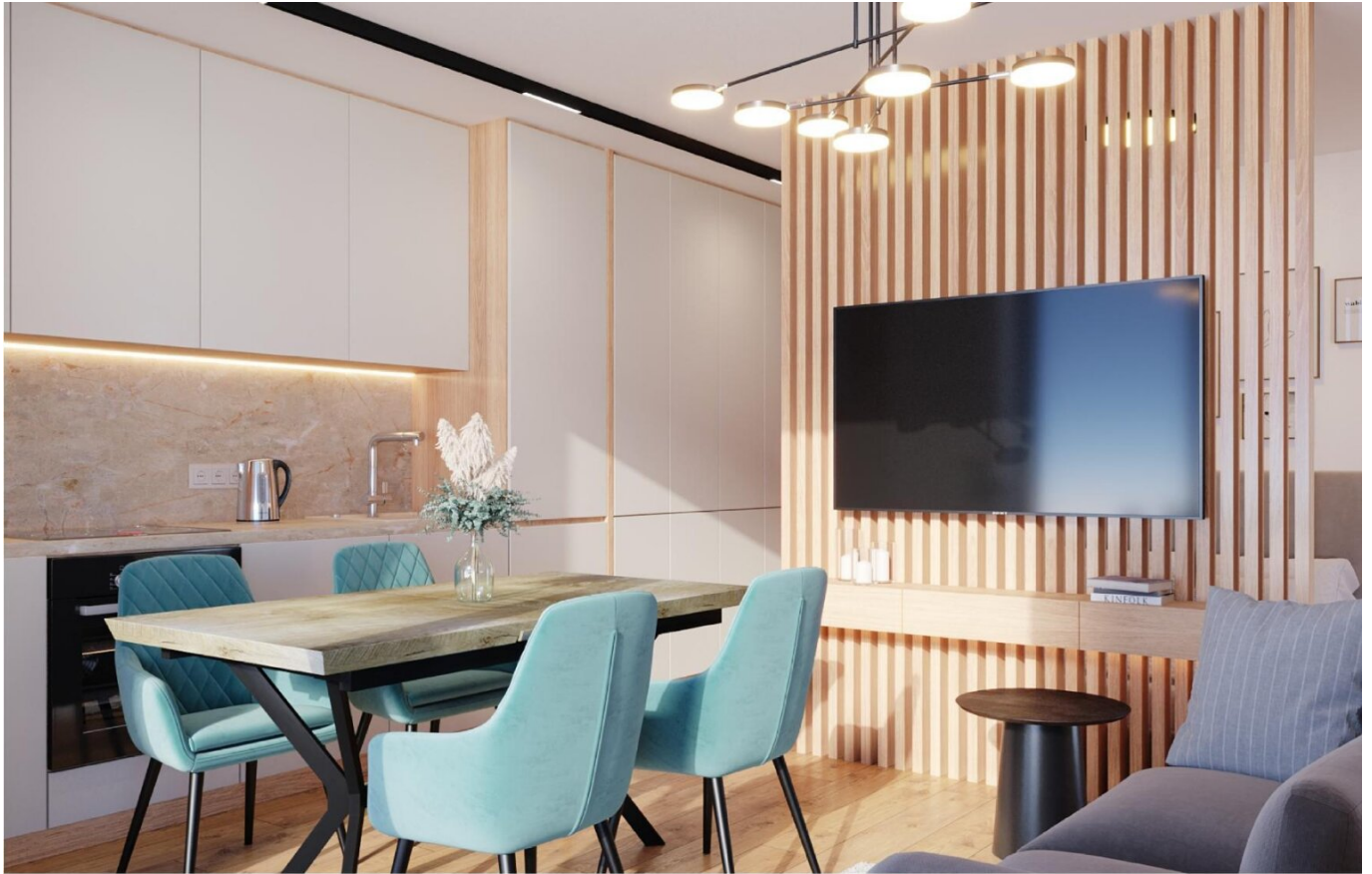
Haus 2 Wohnvariante Kleinwohnung TOP5.1