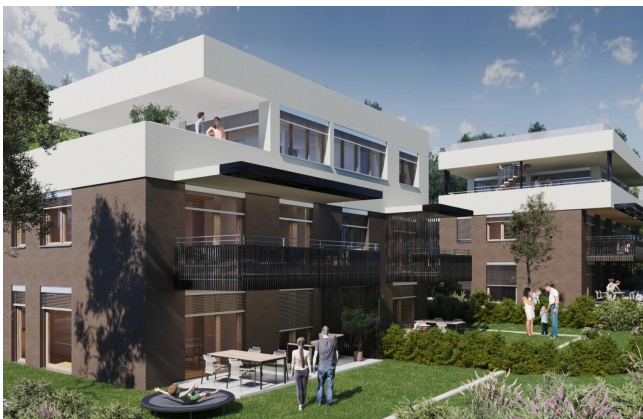
Haus 2 Gartenwohnung TOP5 und TOP6