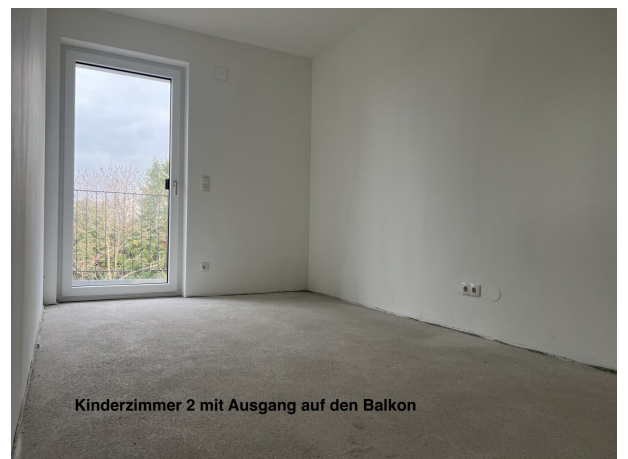
Kinderzimmer 2 mit Ausgang auf den Balkon