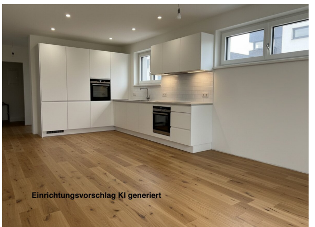
Einrichtungsvorschlag KI generiert