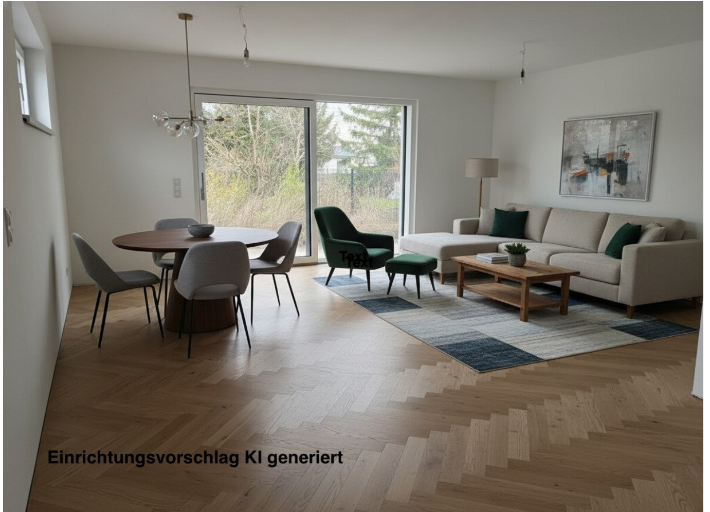
Einrichtungsvorschlag KI generiert