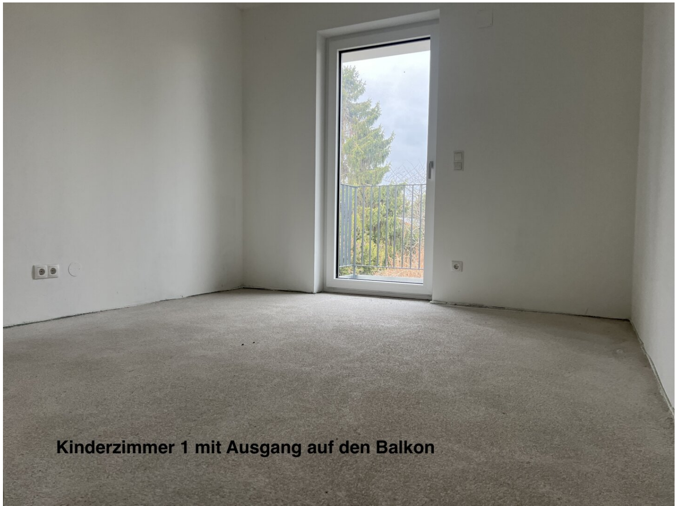
Kinderzimmer 1 mit Ausgang auf den Balkon