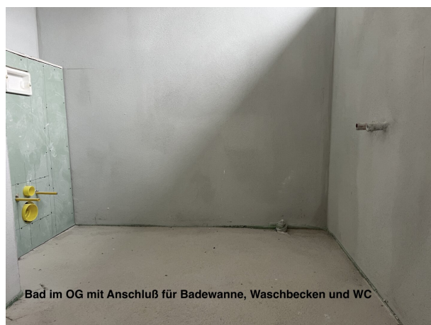
Bad im OG mit Anschluß für Badewanne, Waschbecken und WC