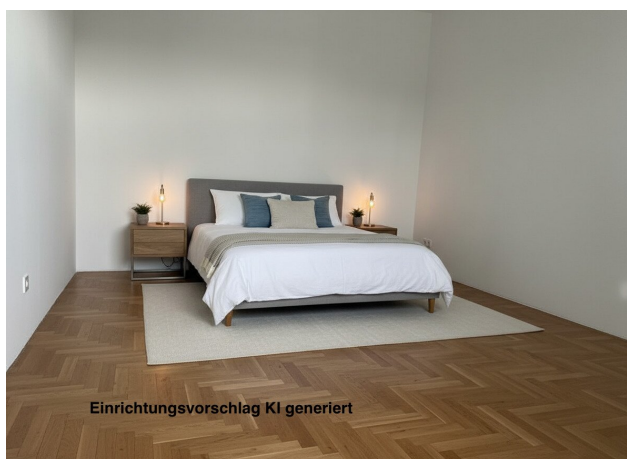
Einrichtungsvorschlag KI generiert