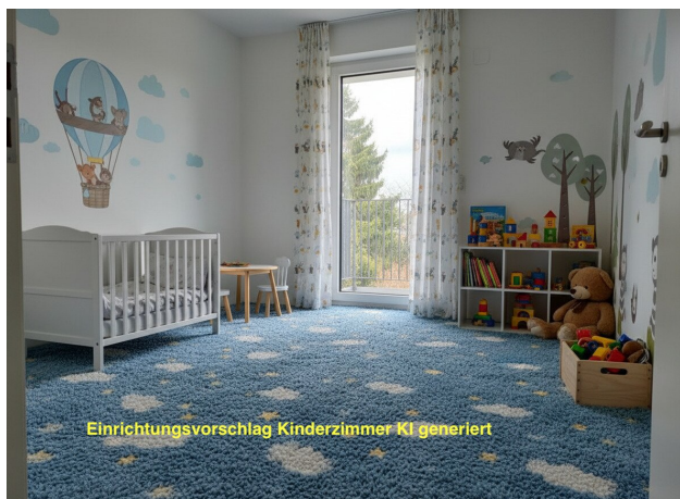
Einrichtungsvorschlag Kinderzimmer KI generiert