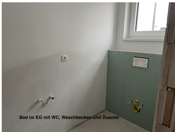
Bad im EG mit WC, Waschbecken und Dusche