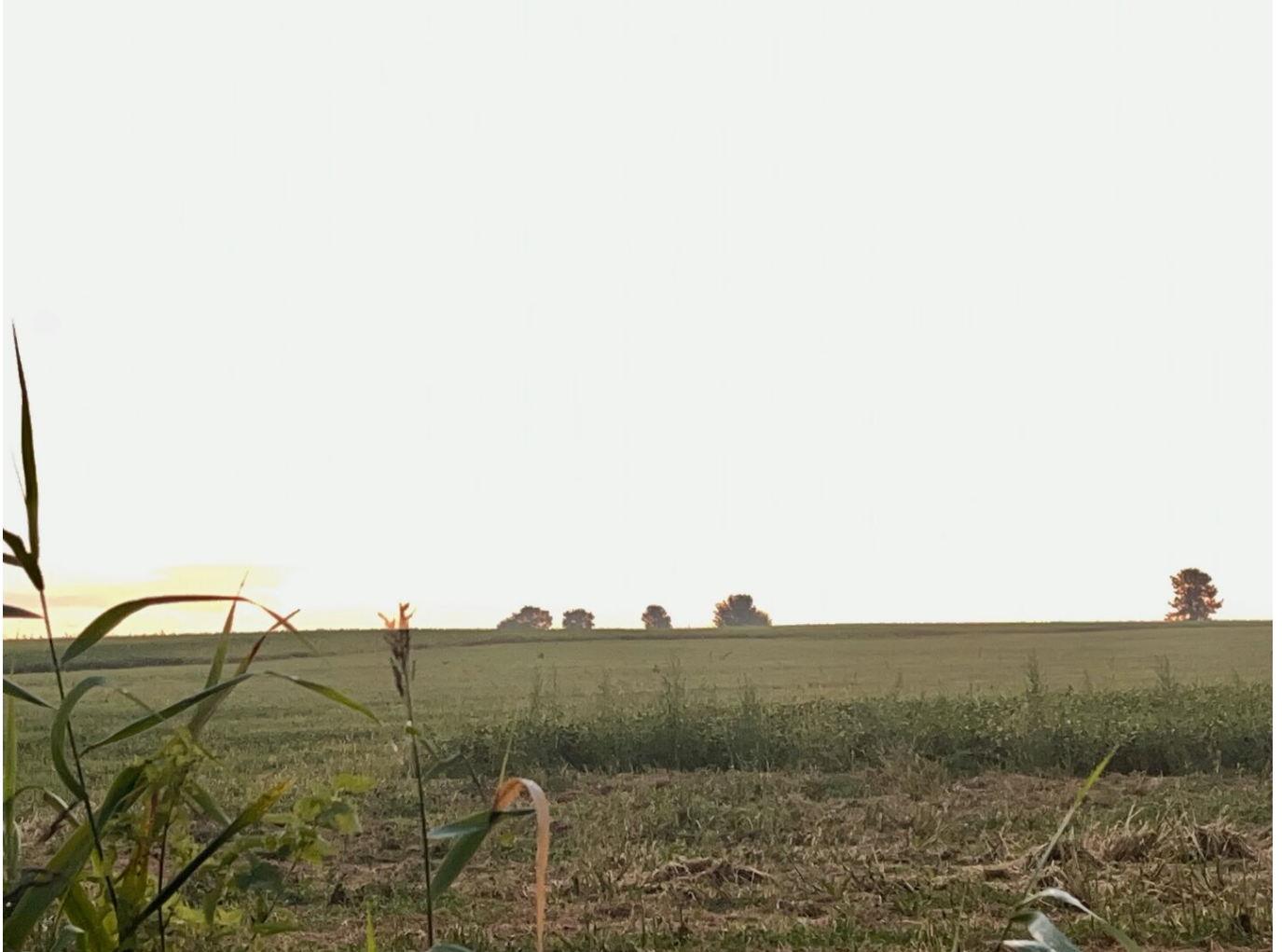
Die Weite - Ausblick nach Süden