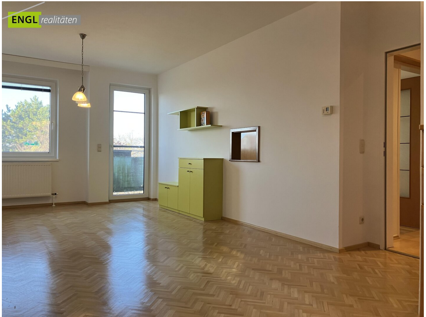
Wohnzimmer mit Balkonausgang