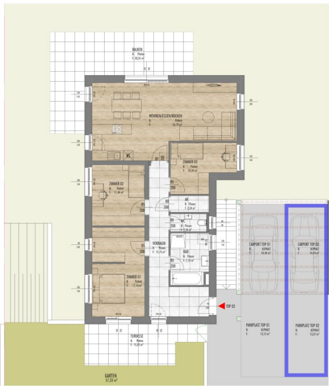
0. Erdgeschoss 1:100