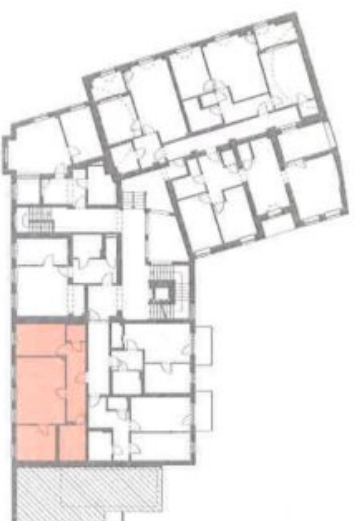
ÜBERSICHT - OG