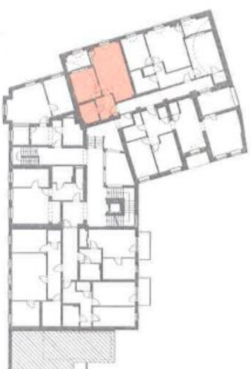
ÜBERSICHT - OG