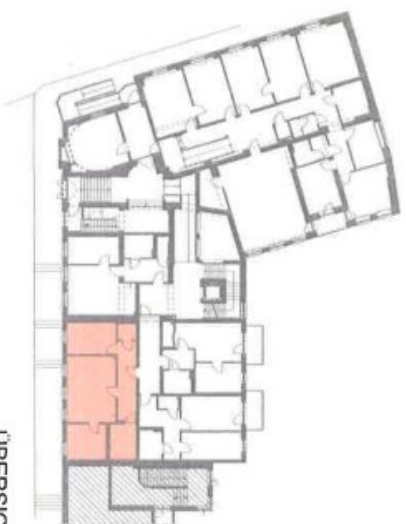
ÜBERSICHT - EG

ATEMPUR ATTAKULA 27. Grundriss 8680 Mürzzuschlag