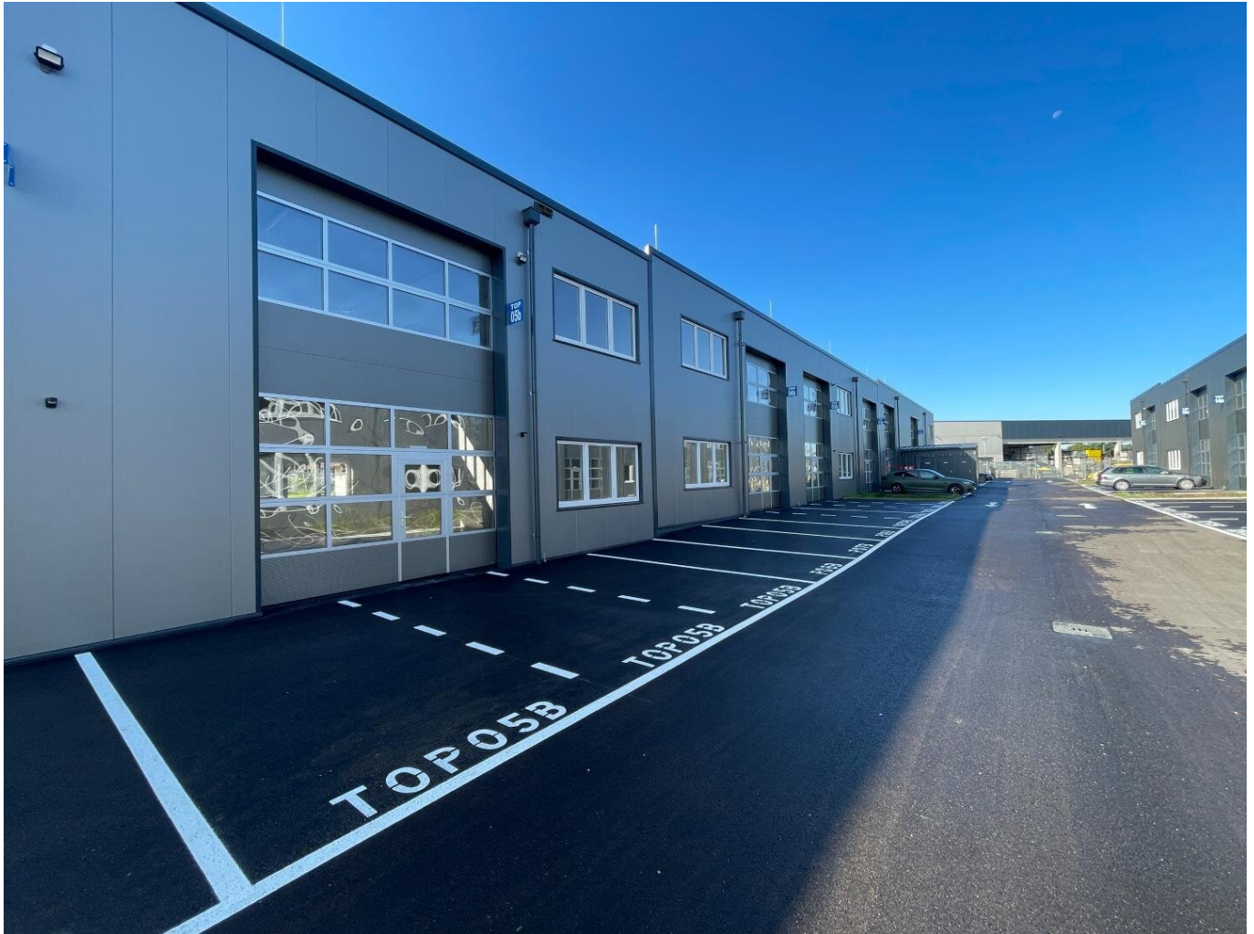
Außenansicht Top 05b