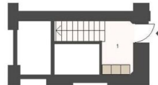
EINGANG IM ZWISCHENGESCHOSS