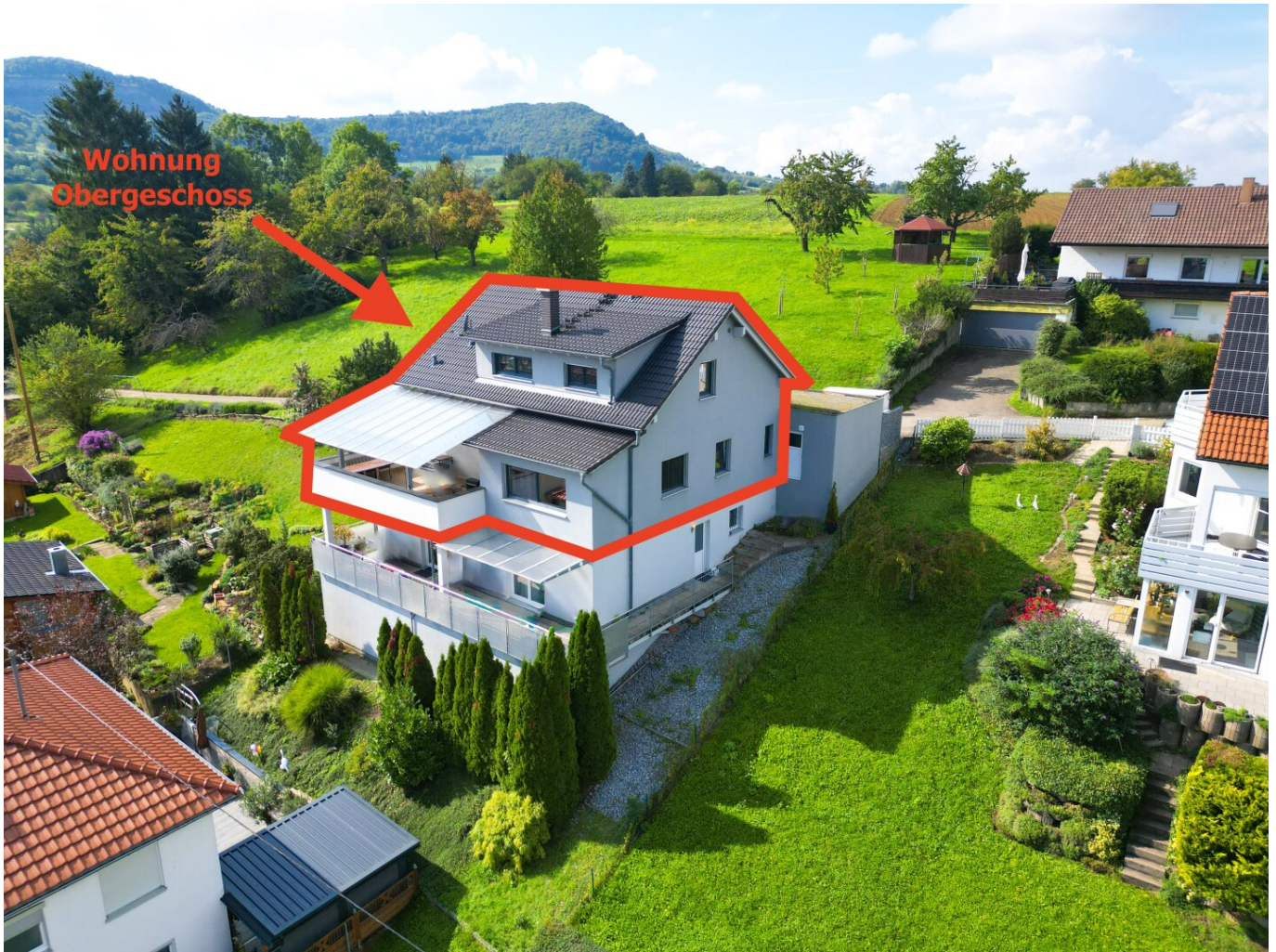
Luftbild mit markierter Wohnung