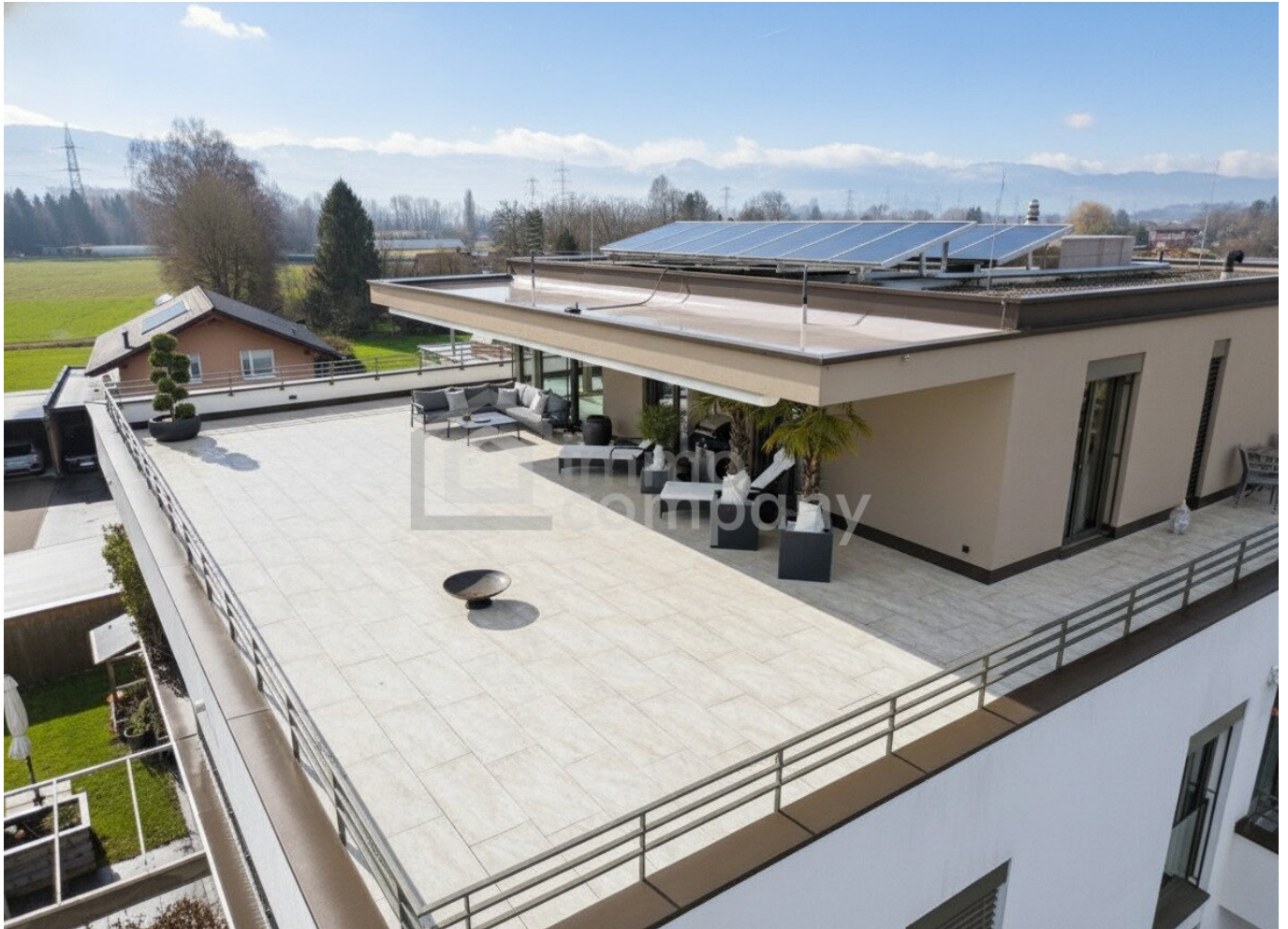
Penthouse - Terrasse 188m 2