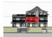
ANSICHT SÜD 1.OG