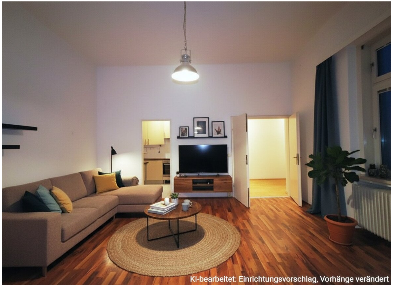
KI-bearbeitet: Einrichtungsvorschlag, Vorhänge verändert