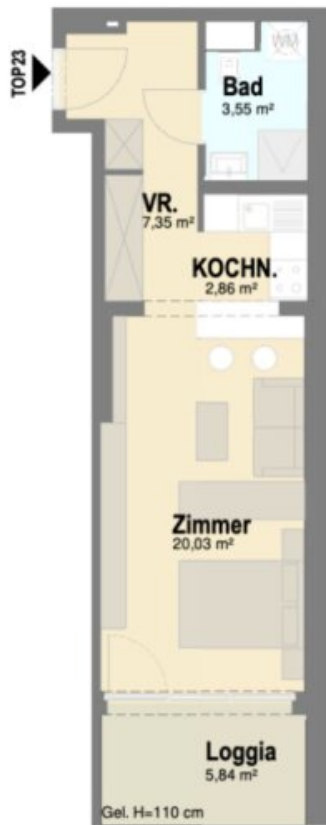
Top 23 33,79 m 2 Loggia 5,84 m 2