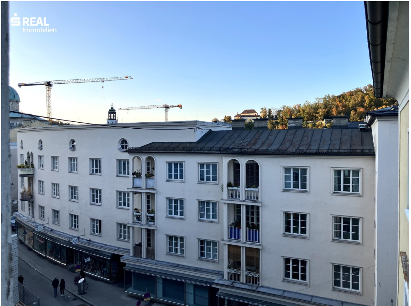
Ausblick bei Abendstimmung