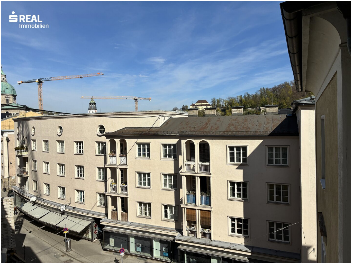
Blick Richtung Kaigasse

Objektnummer: 960/73343 Eine Immobilie von s REAL