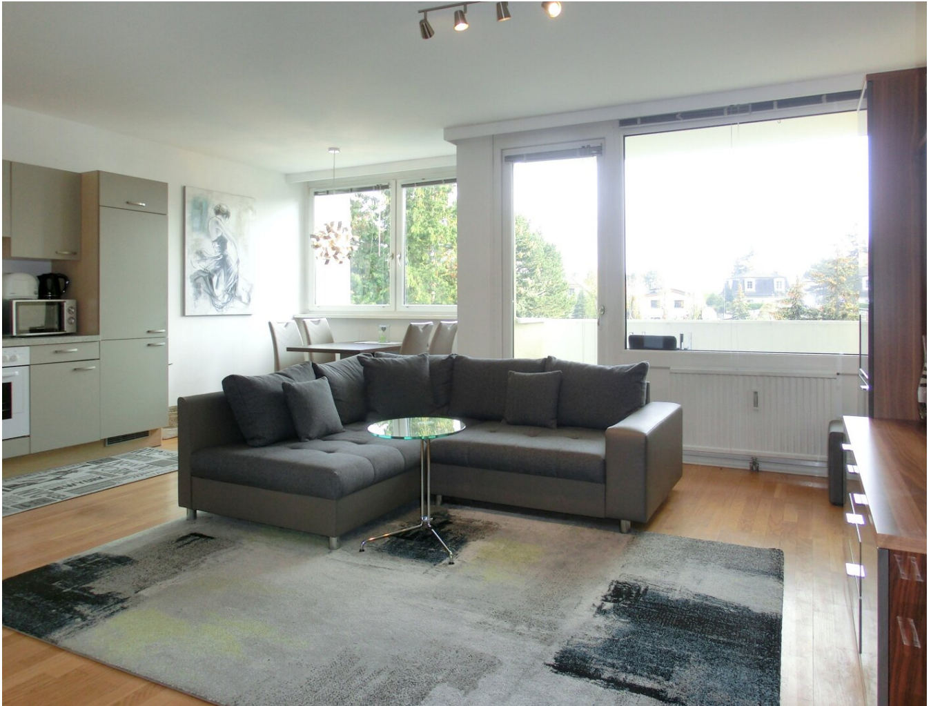
Wohnküche mit Ansicht auf Loggia