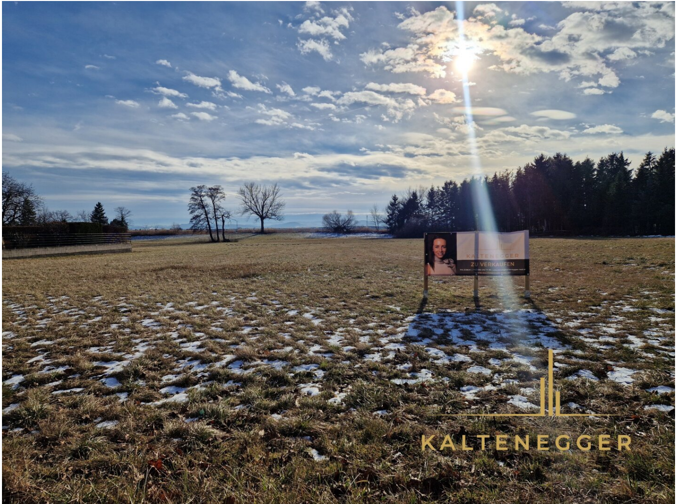
Grundstücksansicht von vorne