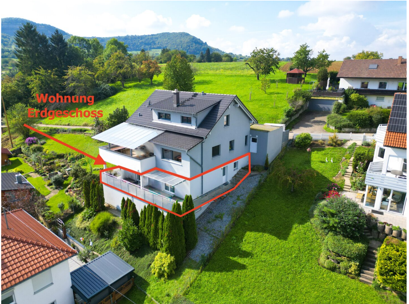
Luftbild mit markierter Wohnung