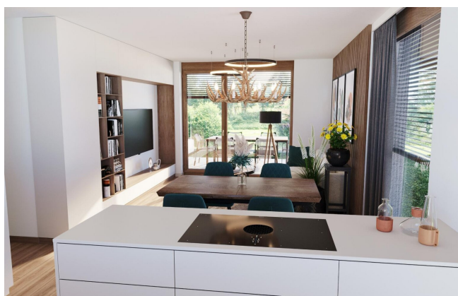
Haus 1 Gartenwohnungen Wohnbereich TOP1, TOP2