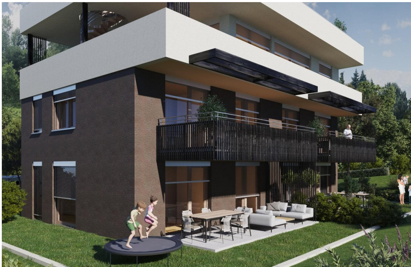
Haus 1 Gartenwohnung TOP1 und TOP2