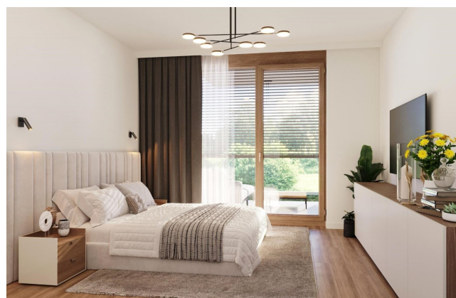
Haus 1 Gartenwohnung Schlafzimmer TOP1 und TOP2