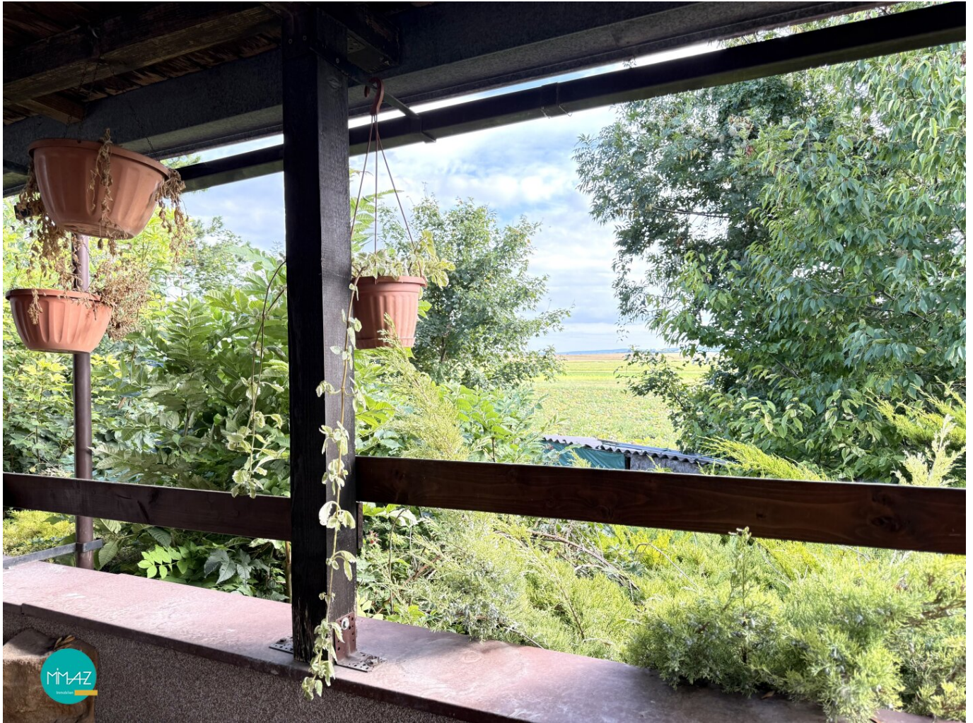
Blick von Terrasse

Viel Platz für neue Ideen! Einfamilienhaus mit großem Garten und Weitblick im Wiener Umland! Vielseitig nutzbar!