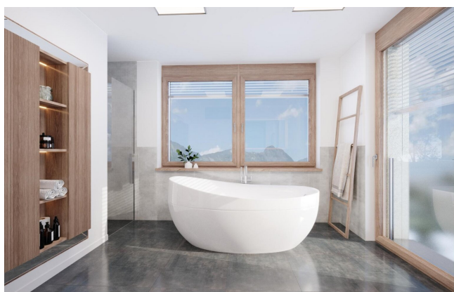
Haus 2 Penthousewohnung OG2 Bad TOP8