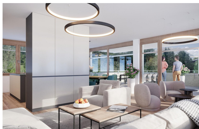
Haus 2 Penthousewohnung OG2 Wohnen TOP8