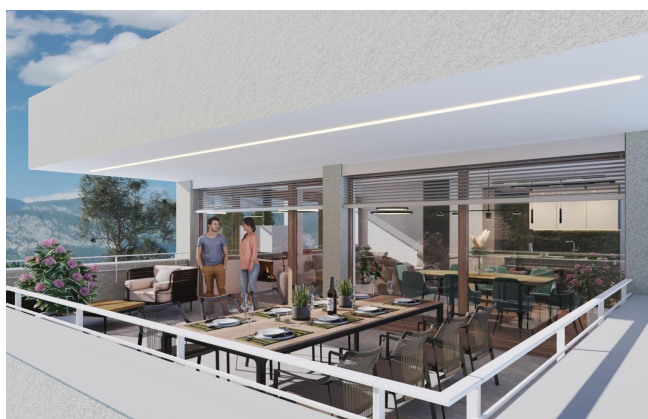
Haus 2 Penthousewohnung OG2 Terrasse TOP8