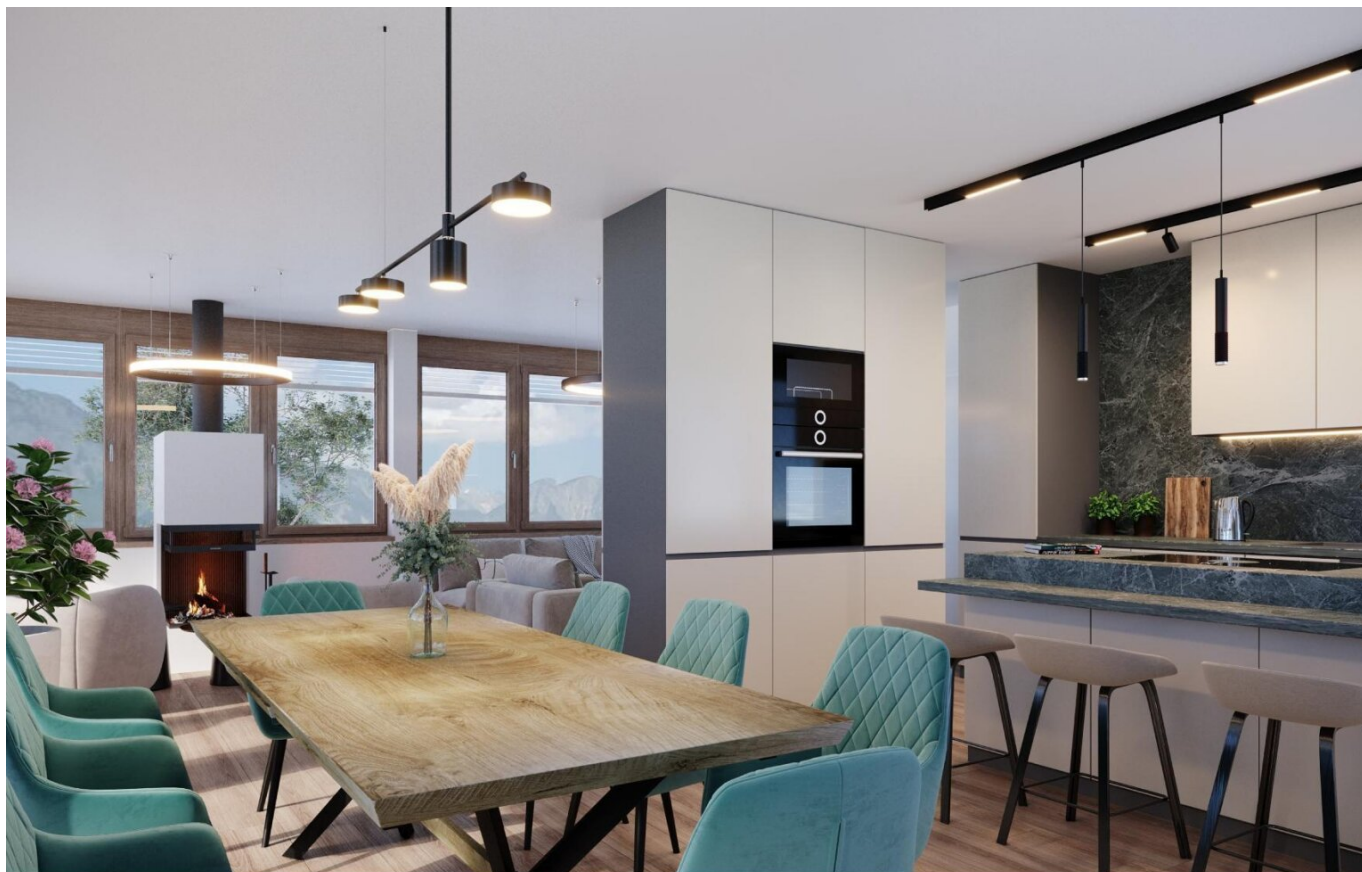
Haus 2 Penthousewohnung OG2 Wohnen TOP8