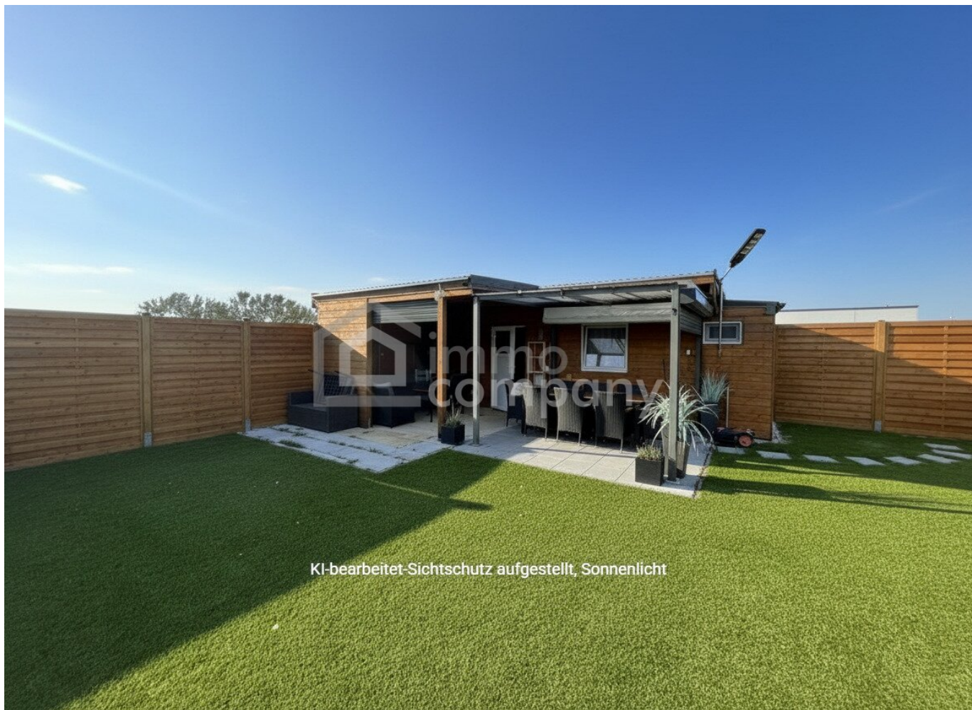
KI-bearbeitet-Sichtschutz aufgestellt, Sonnenlicht