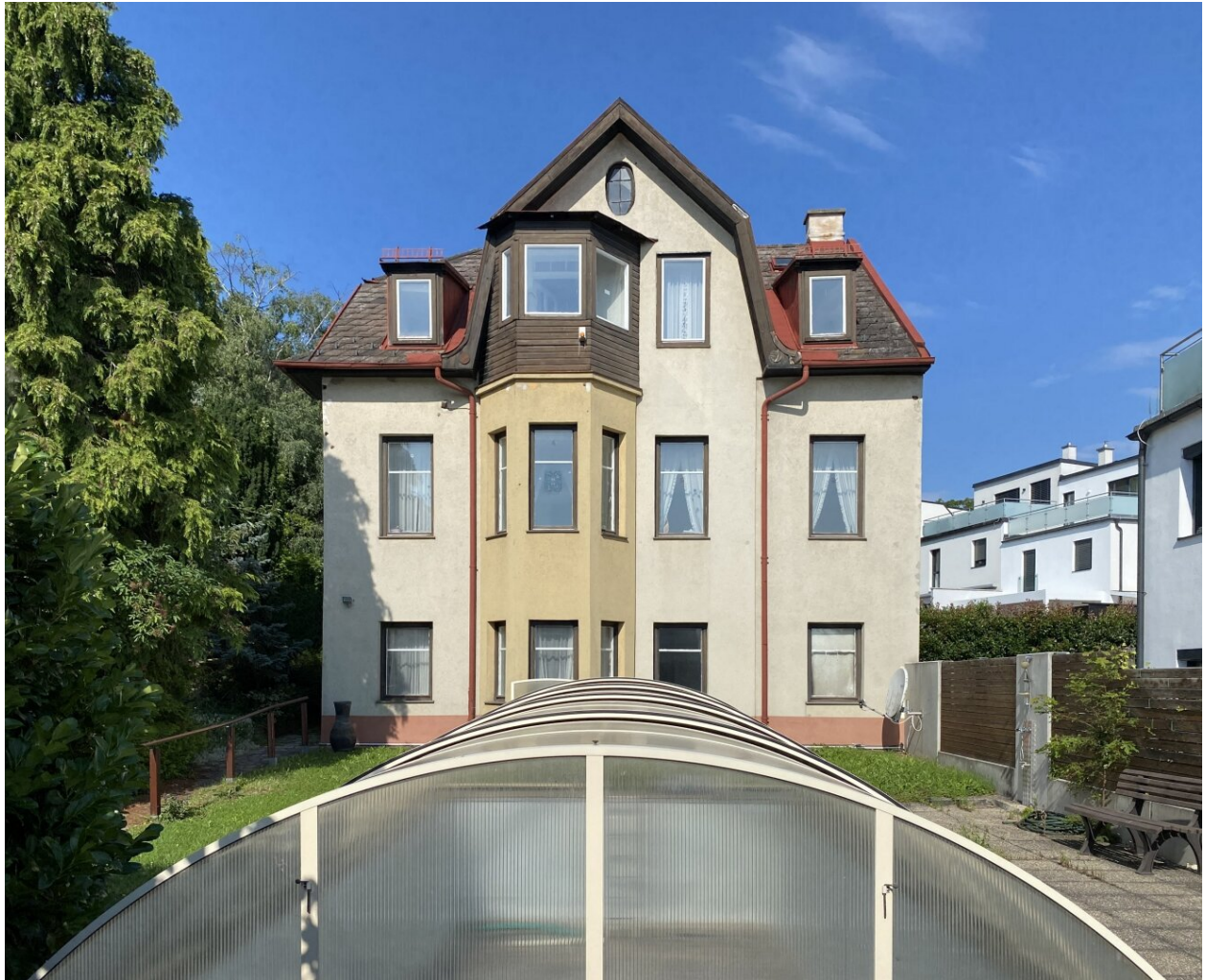
Vorderansicht mit Pool