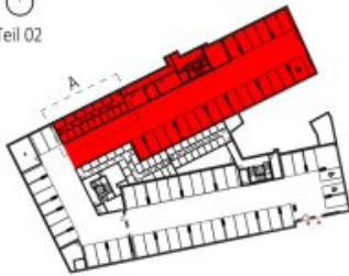
Übersicht Untergeschoss M=1 : 1500