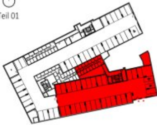
Übersicht Untergeschoss M=1 : 1500