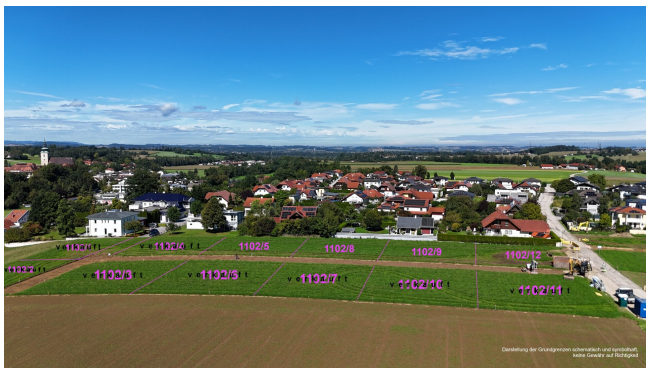
Darstellung der Grundgrenzen schematisch und symbolhaft, keine Gewähr auf Richtigkeit