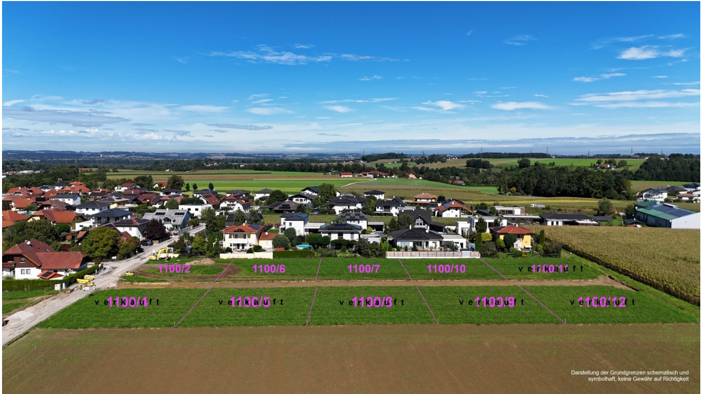
Darstellung der Grundgrenzen schematisch und symbolhaft, keine Gewähr auf Richtigkeit