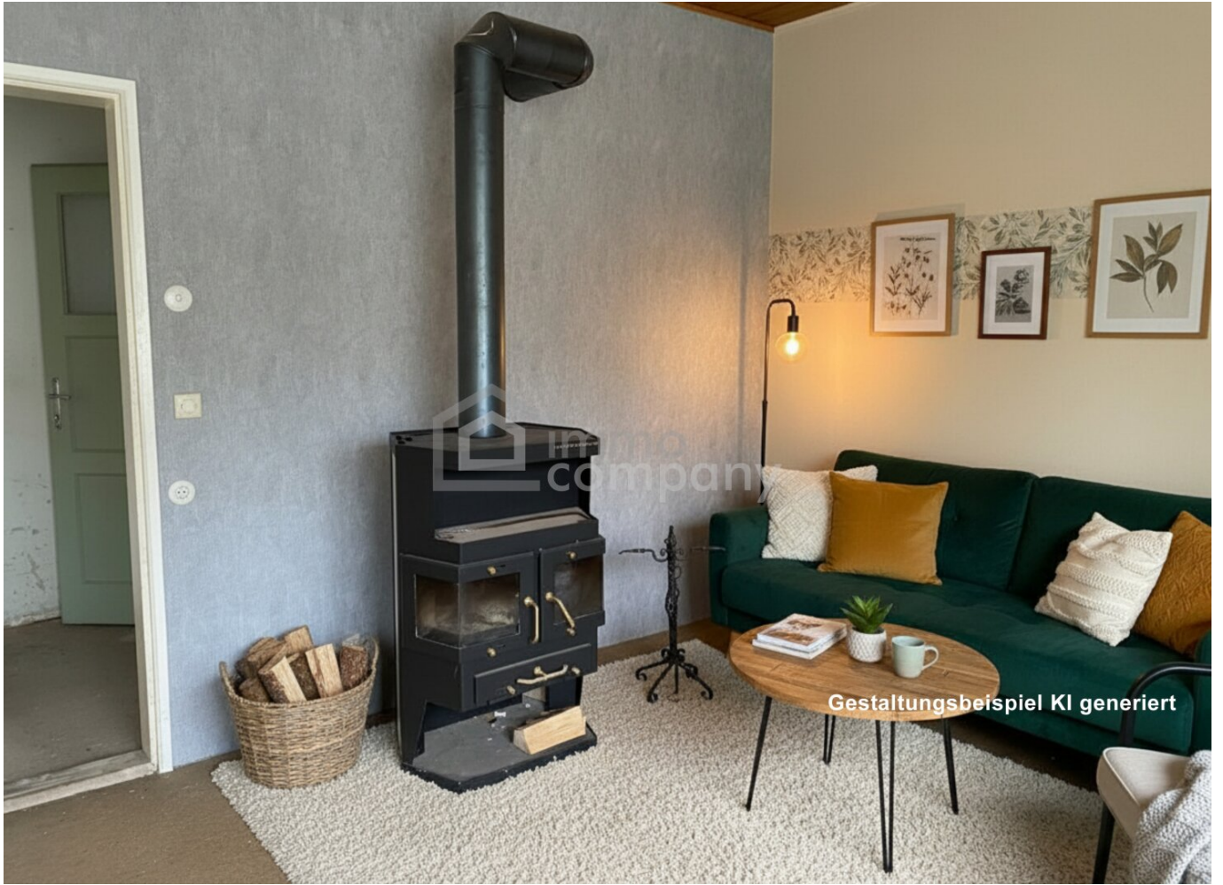
Gestaltungsbeispiel KI generiert