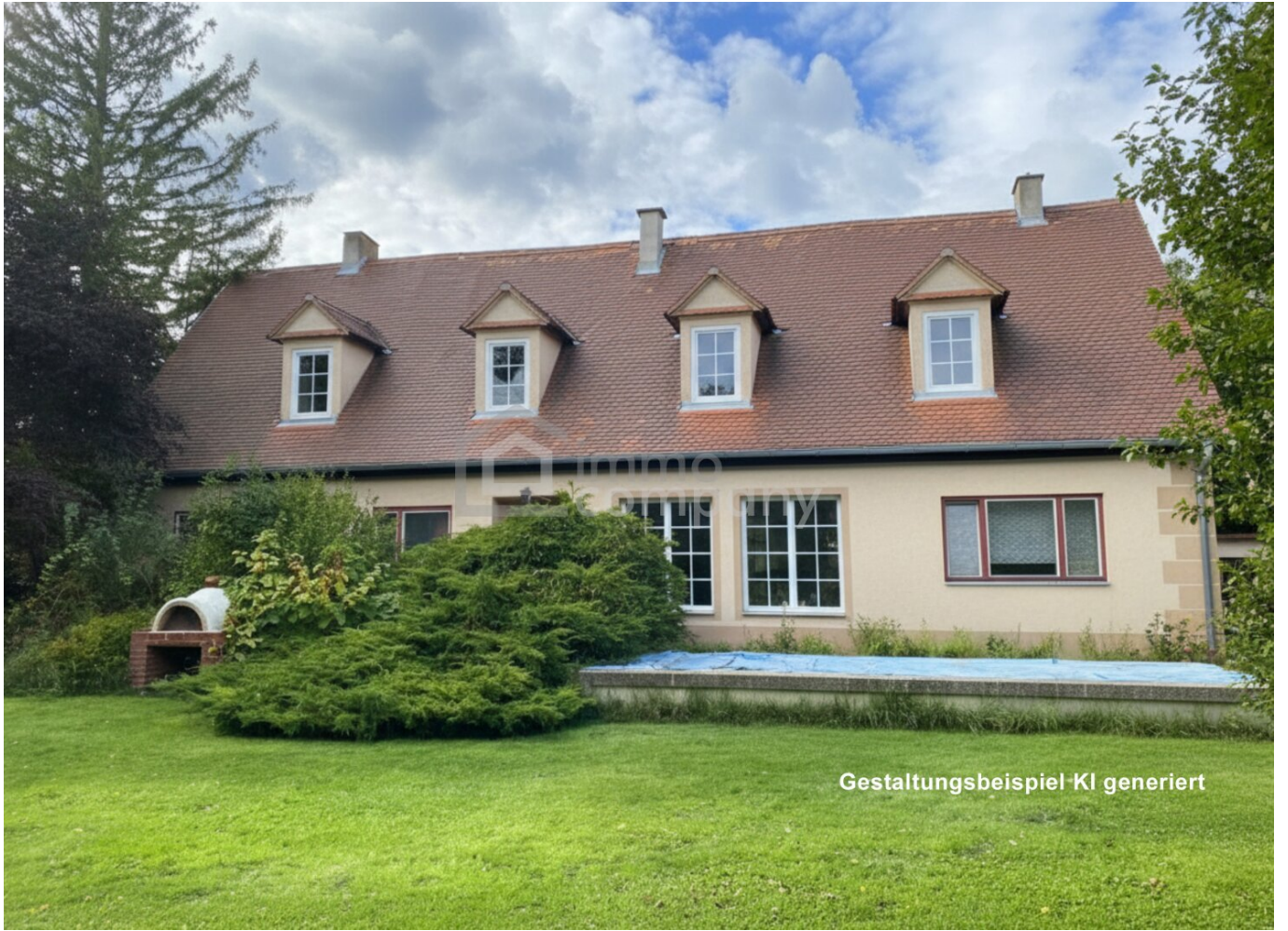
Gestaltungsbeispiel KI generiert