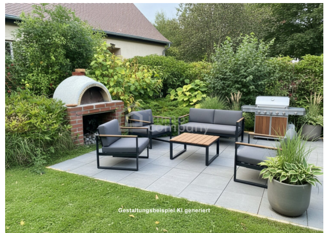
Gestaltungsbeispiel KI generiert