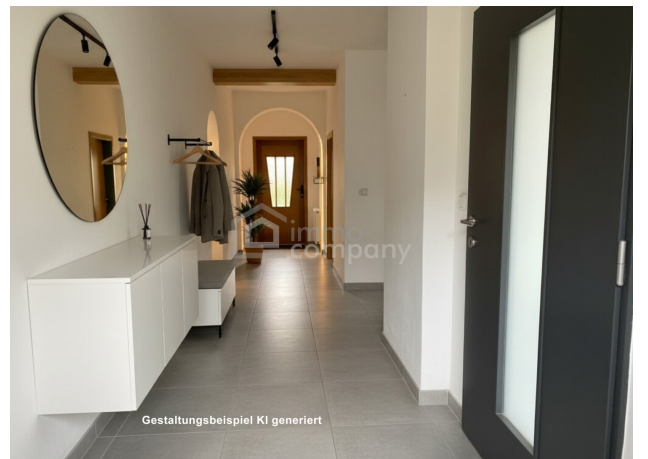
Gestaltungsbeispiel KI generiert