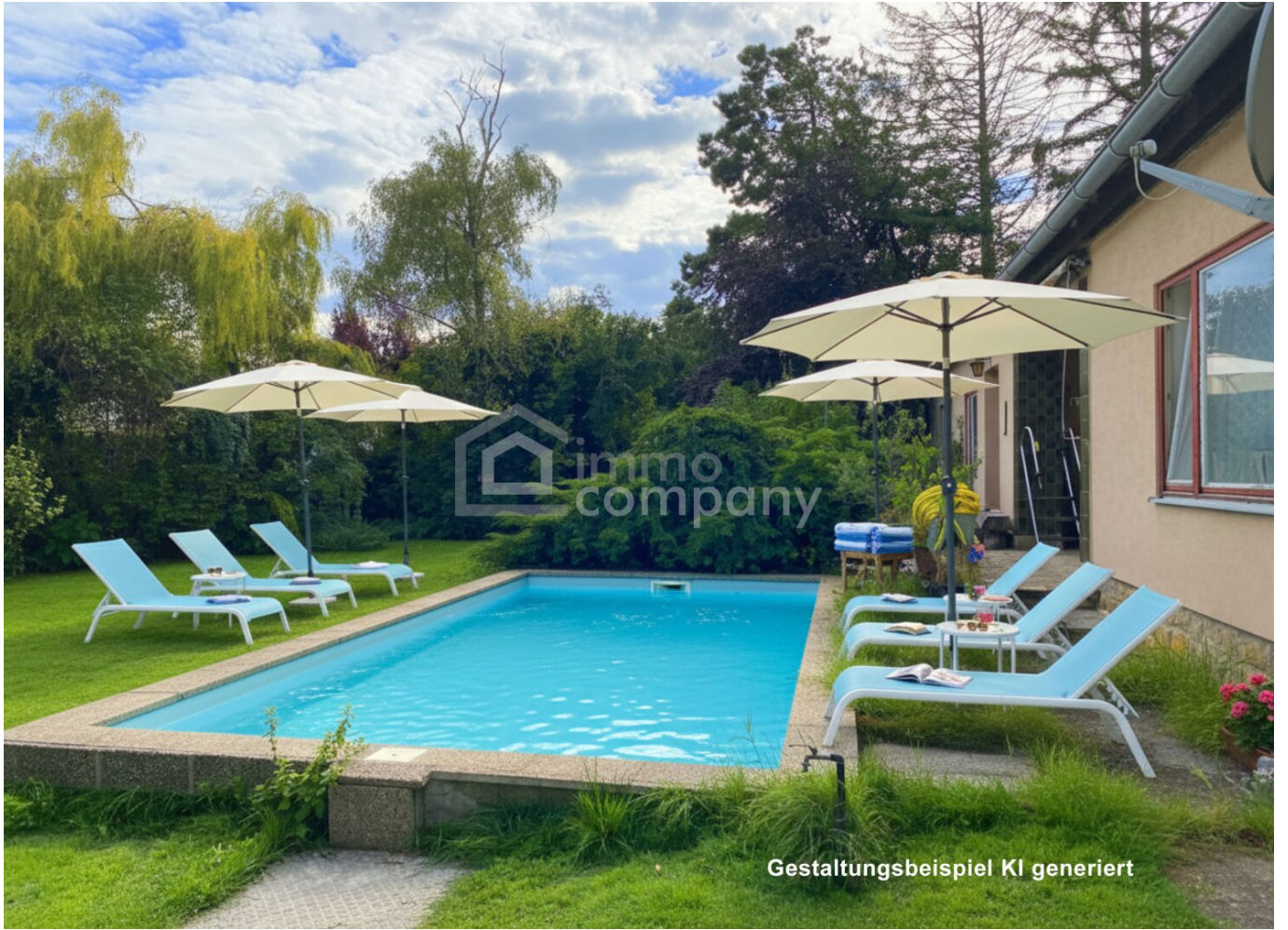
Gestaltungsbeispiel KI generiert