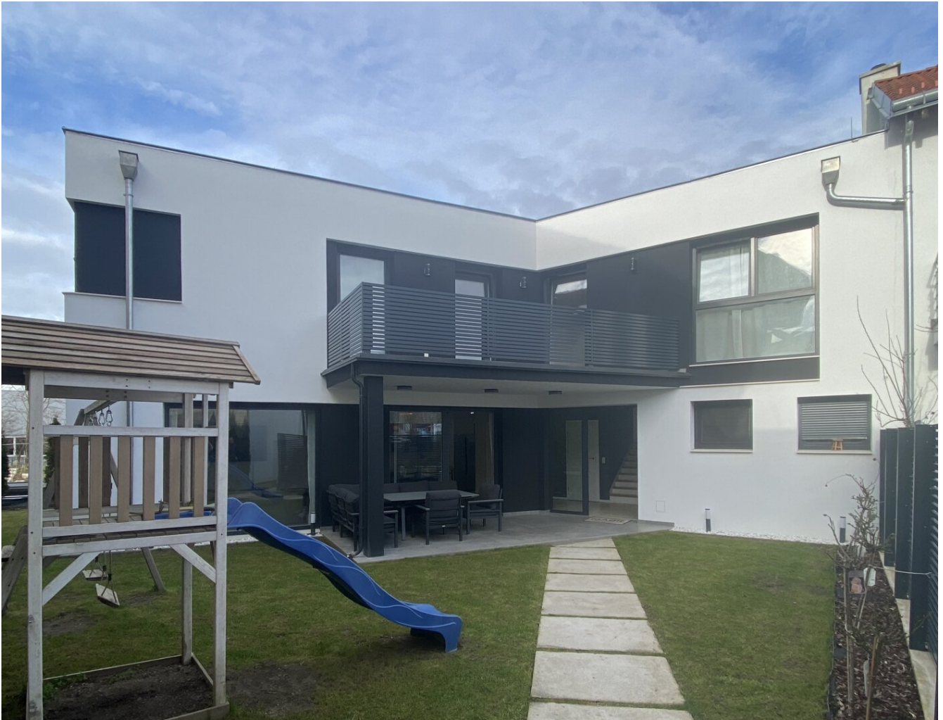
Ansicht Haus mit Garten