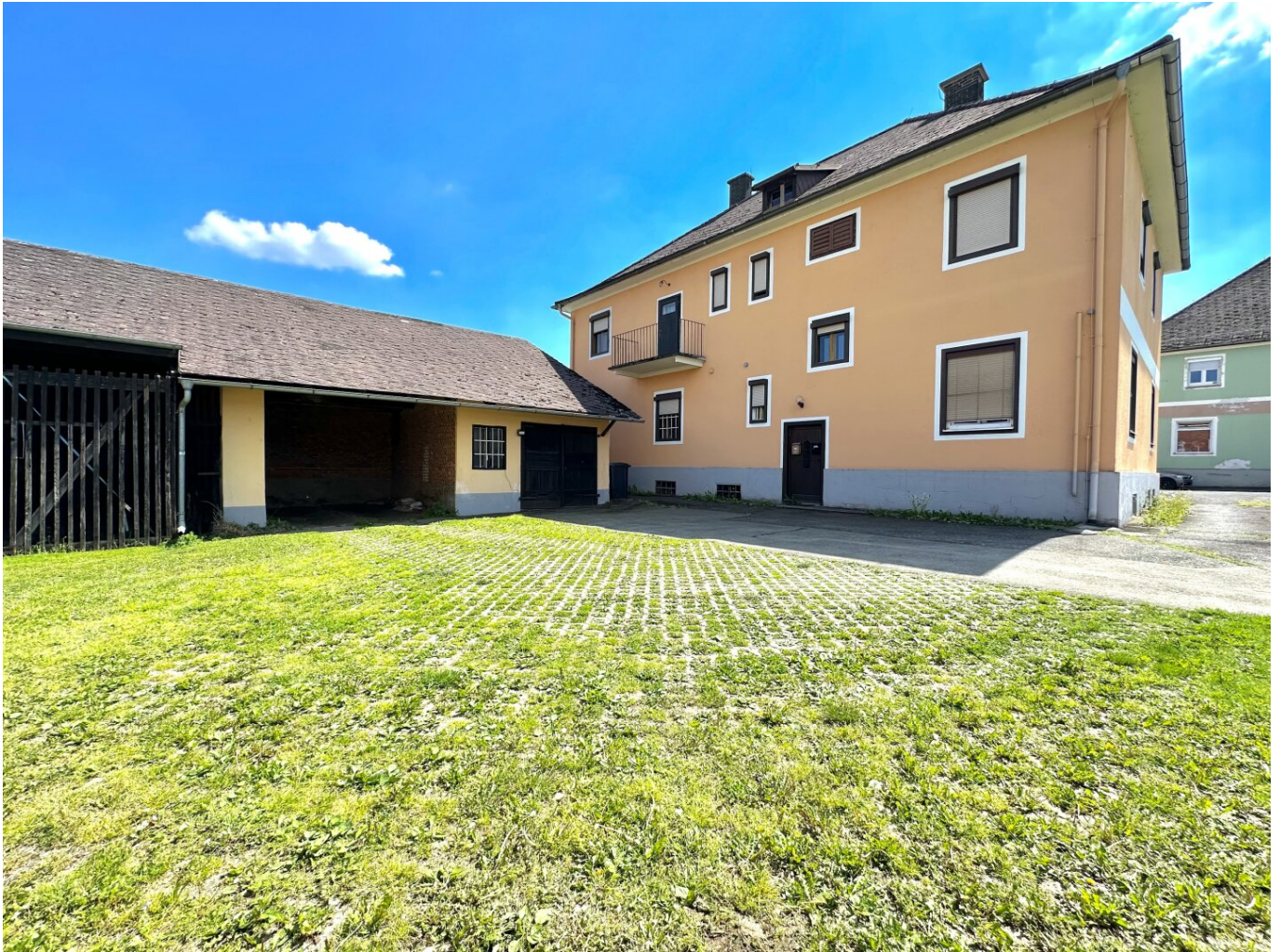
Hausansicht - Innenhof

Attraktives Renditeobjekt *** 6,38% Rendite *** in Halbenrain - voll vermietet!!!