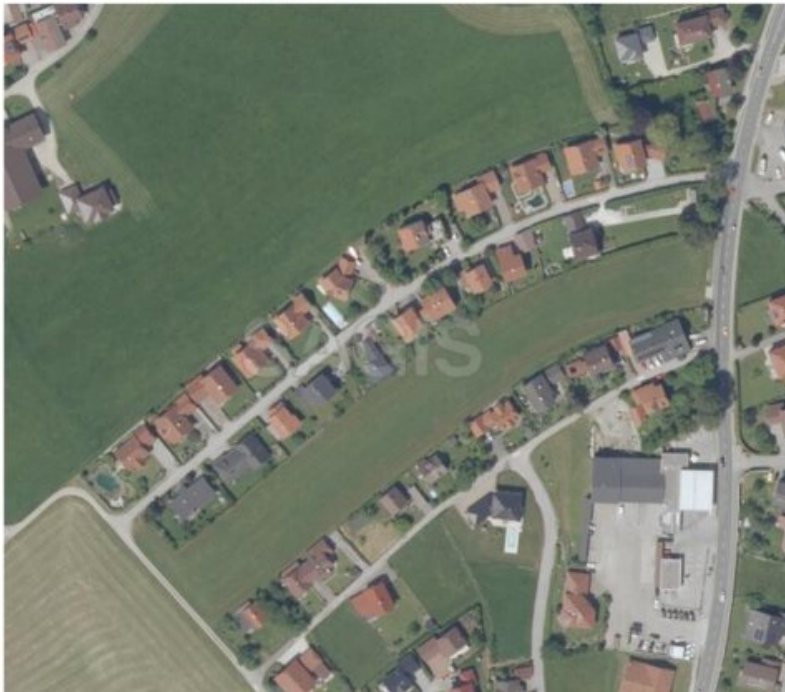
Abb.: Orthofoto des Planungsgebiets

Das Planungsgebiet weist eine Gesamtfläche von 12.100 m 2 auf.