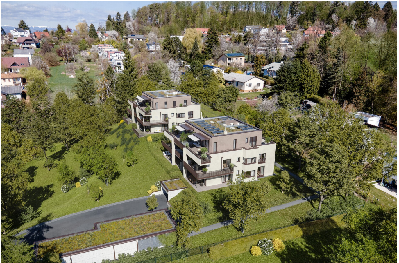
Luftschloss View 2

Objektnummer: 109251174_3 Eine Immobilie von ÖRAG Immobilien