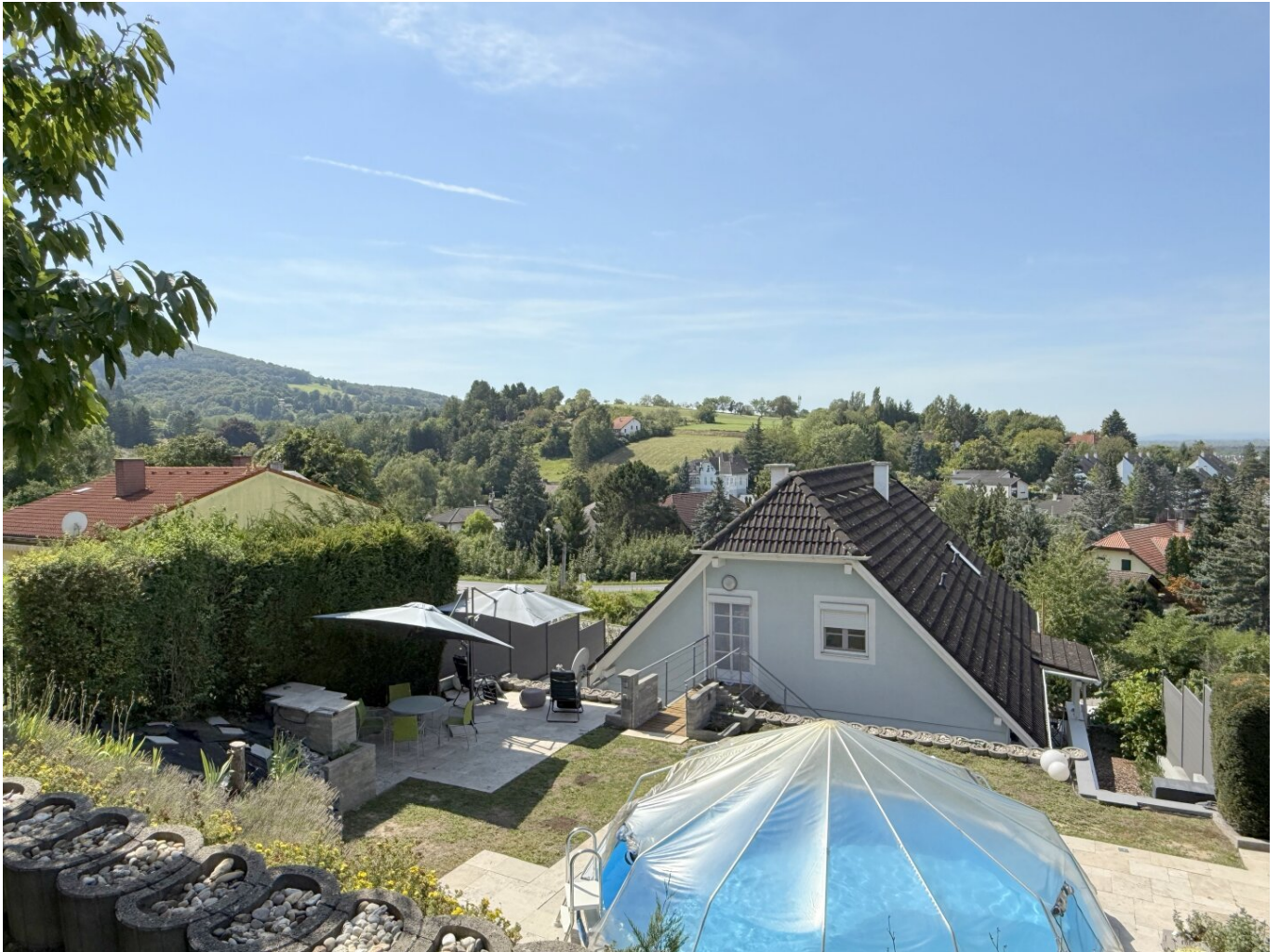
Blick vom Garten aus