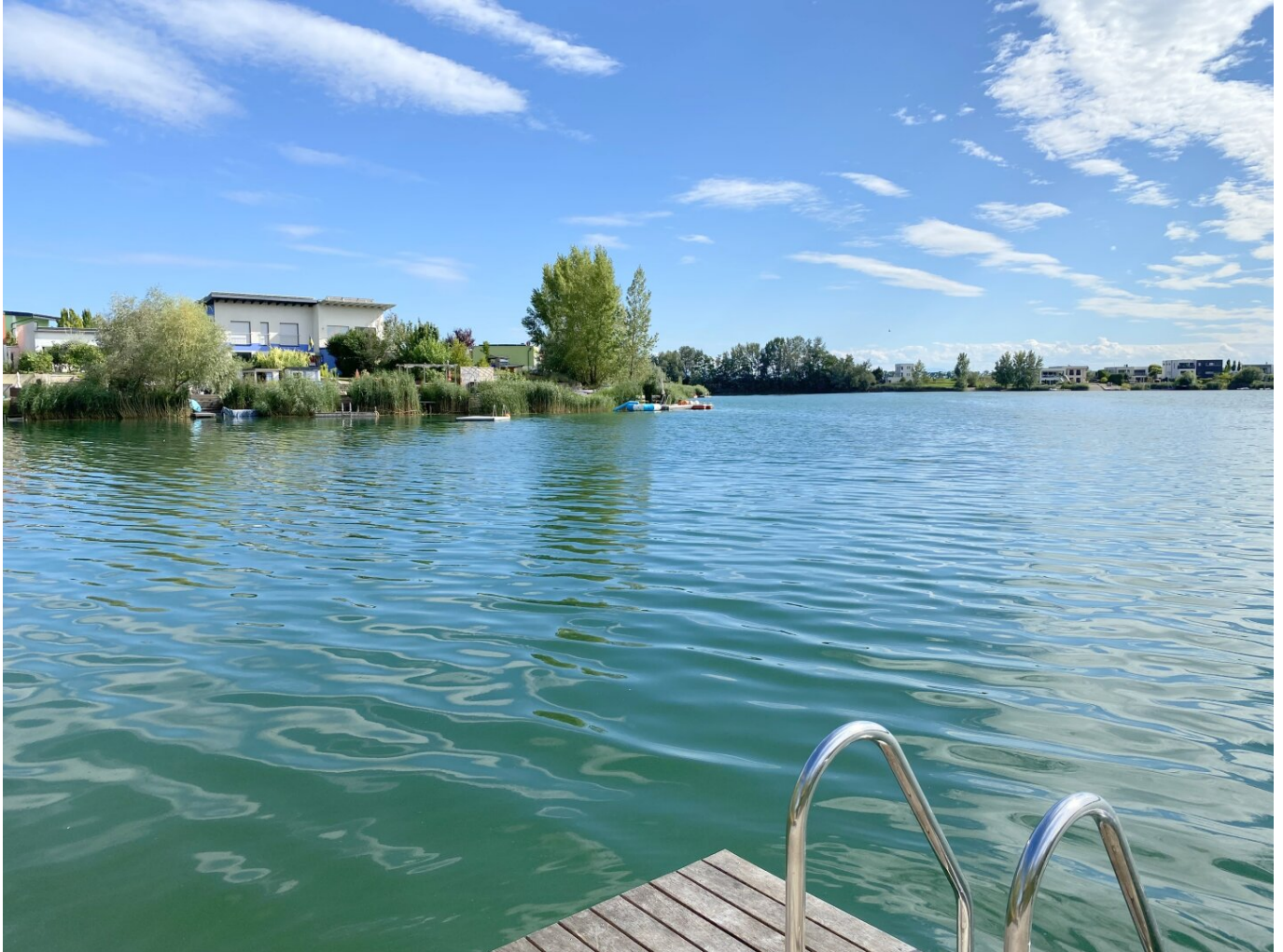
Einstieg in den See