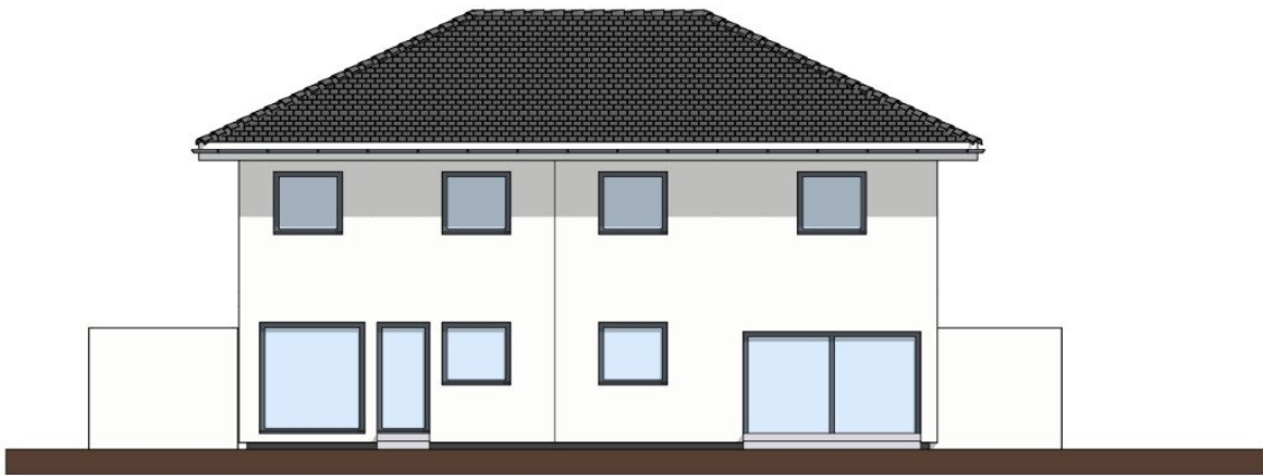
Westansicht M 1: 100 25. November 2025 0 Zchn: SA 5m

Haus 1 - Smart Life 93 Haus 2 - Smart Life 114