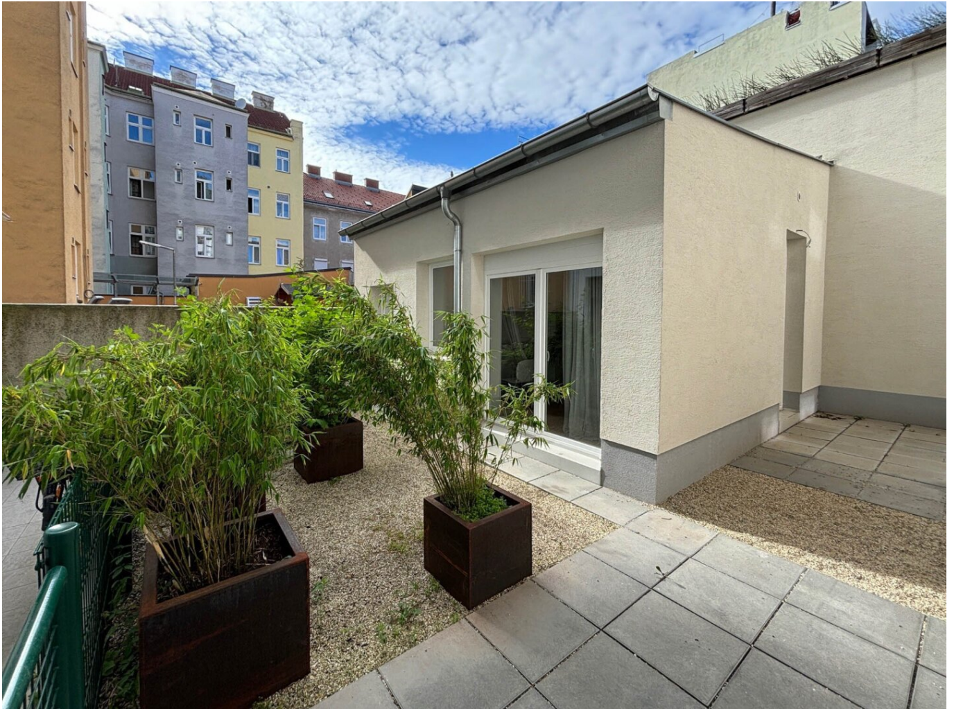
Vorplatz / Terrasse